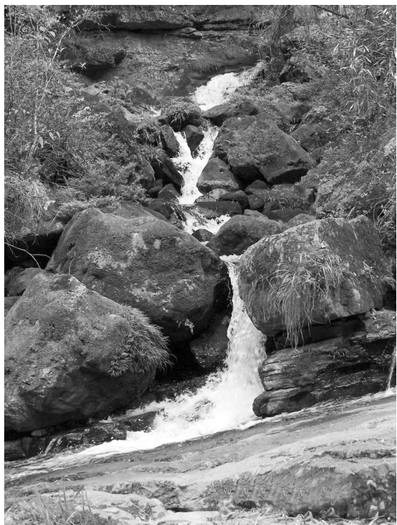
屈原故里秭归县风景图