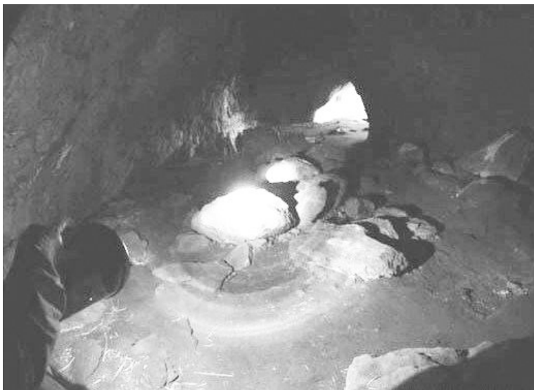
嘎仙洞洞内的石室，鲜卑族先民曾寄居于此。

鲜卑拓跋部最初和当时大部分的少数民族一样，都处于原始社会的末期。后来，拓跋珪登上了王位，并挑起了重振拓跋部的重任，拓跋部于是开始渐渐地强大起来。鲜卑拓跋部落原始的社会形态也在此时期慢慢开始瓦解了，鲜卑拓跋部最终得以步入了奴隶社会时期。此时，秦汉王朝先后建立，封建专制主义制度在历史的发展中不断完善，秦朝建立了三公九卿制度、郡县制度，汉朝建立了封邦建国制度等，这一切对居于北方的少数民族产生了巨大的影响，北方少数民族首领们纷纷开始学习汉学，并希望从中吸取治国安邦的策略，鲜卑族也