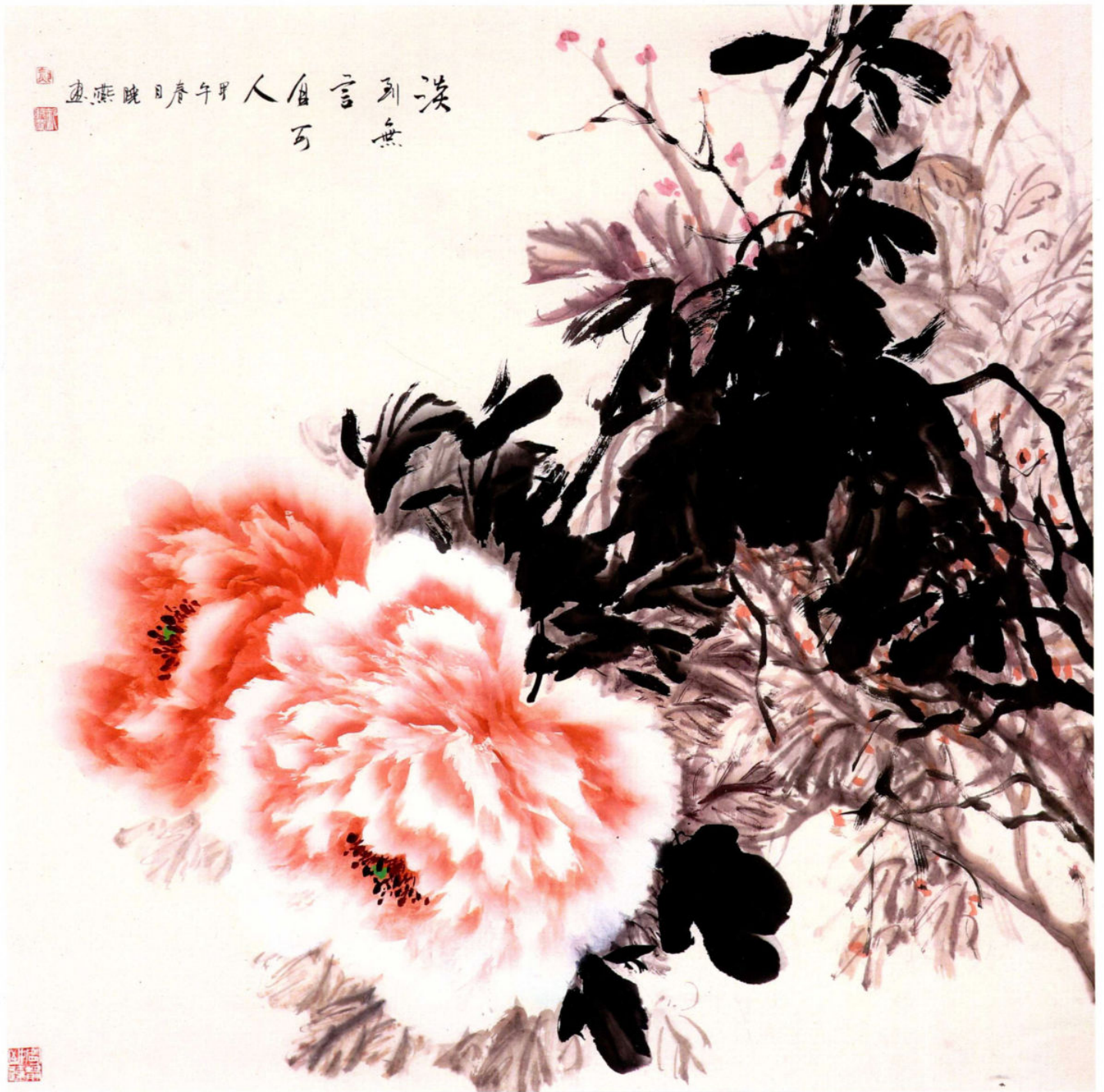
淡到无言自可人 2018年 纸本设色 68cm × 68cm