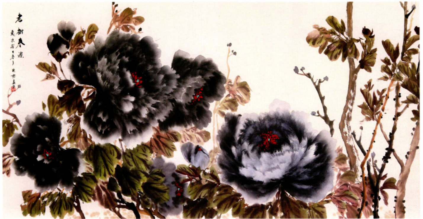
老树春深 2011年 纸本设色 68cm × 136cm