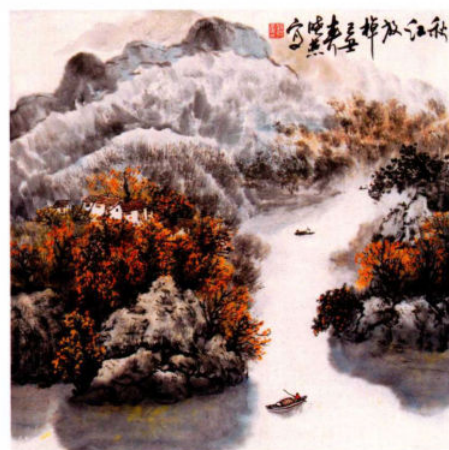
秋江放棹 2009年 纸本设色 68cm × 68cm

读郝晓燕的中国画，就像品味杯中深琥珀色的佳酿，视觉、味道、意境皆在其中。文如其人，画亦如此。任何艺术作品所蕴含的气度，往往与人的内心世界有着某种必然联系。晓燕作品里的笔意气韵，空灵传神，精致大气，凝重里透着淡雅，一如晓燕其人。