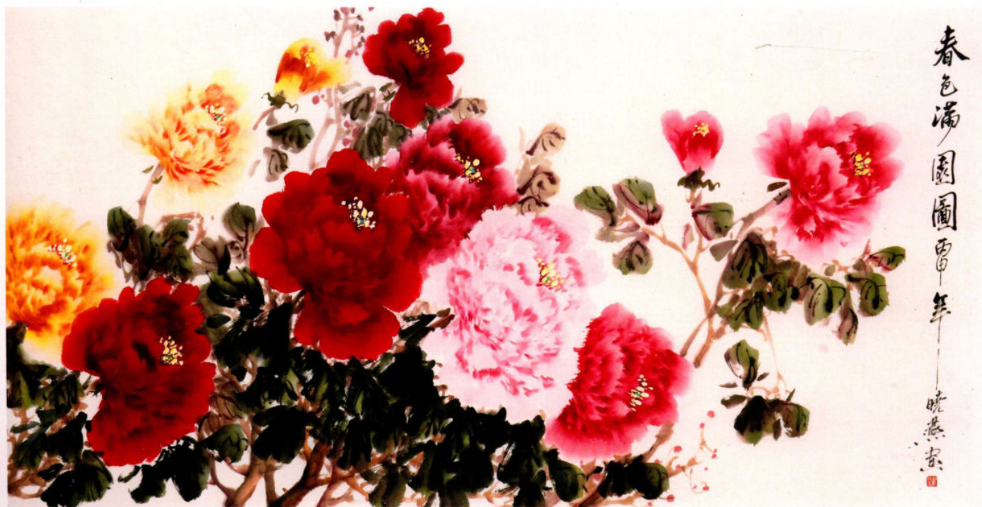
春色滿園圖之六 2016年 紙本設色 68cm × 136cm