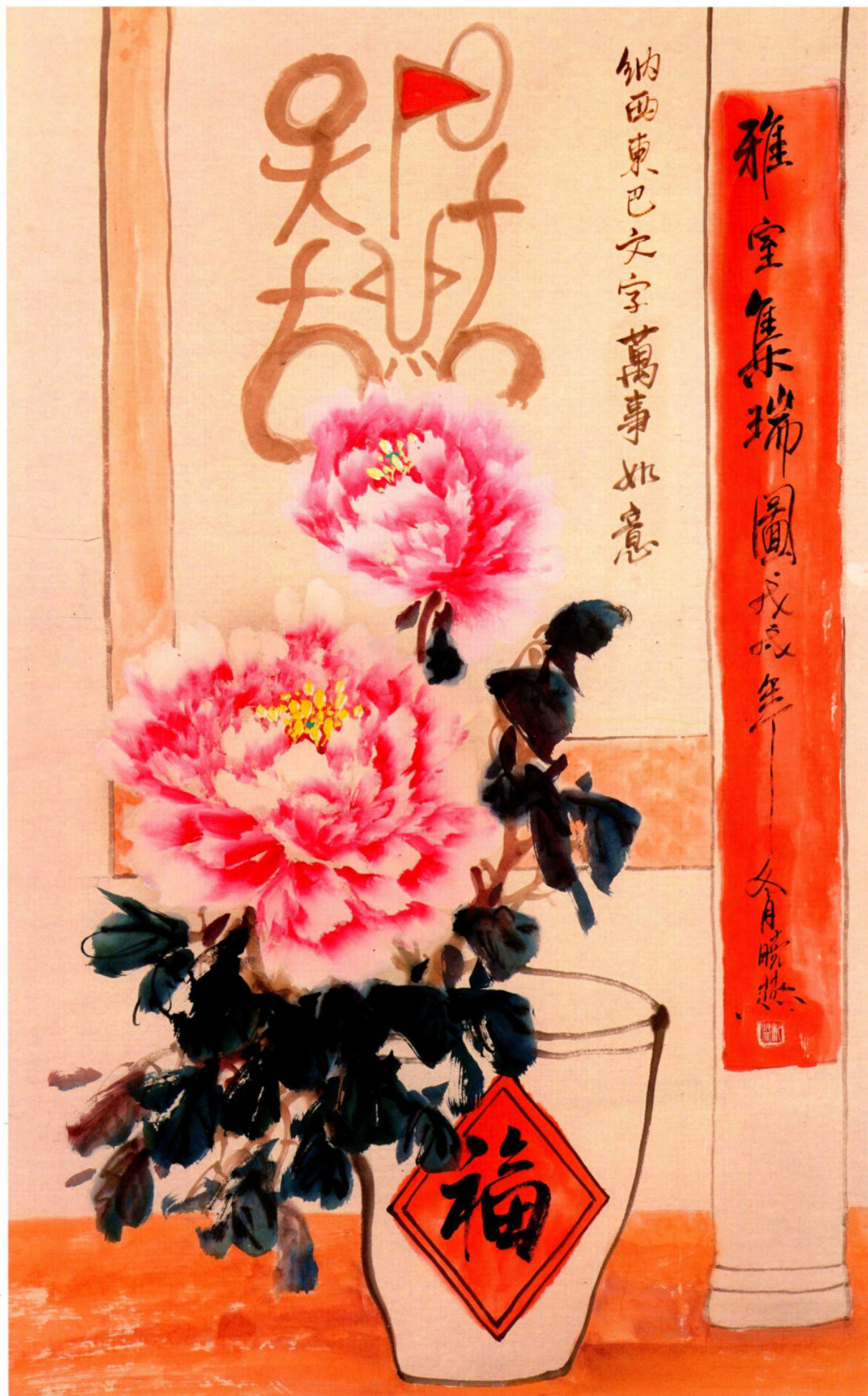
雅室集瑞图之一 2018年 纸本设色 90cm x 60cm