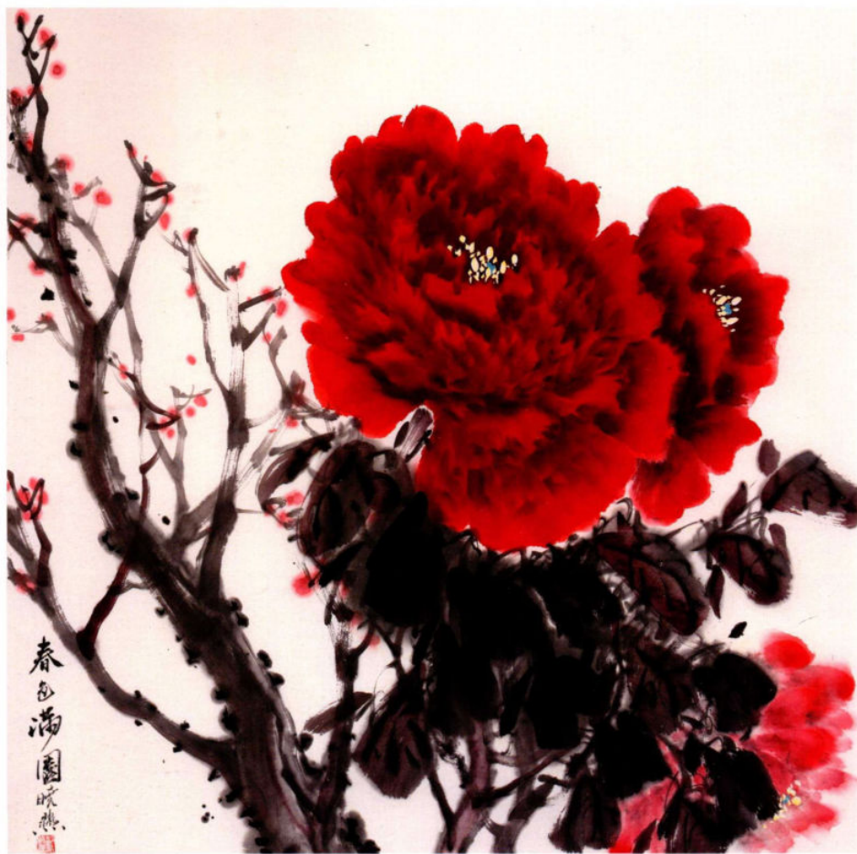
春色满园之二 2014年 纸本设色 68cm x 68cm