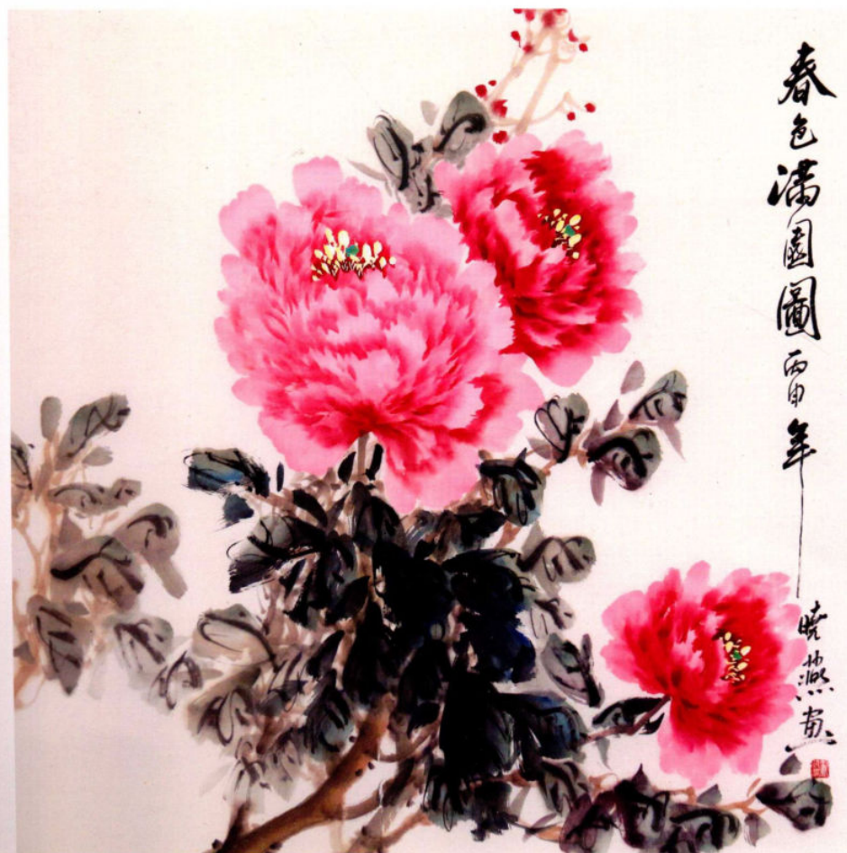
春色满园图之三 2014年 纸本设色 68cm x 68cm