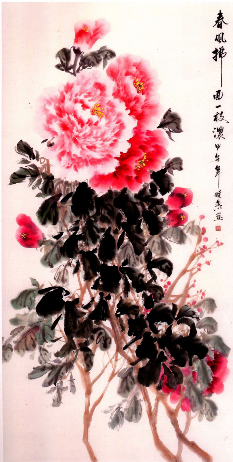
春風拂面一枝濃之二 2014年 紙本設色 136cm × 68cm