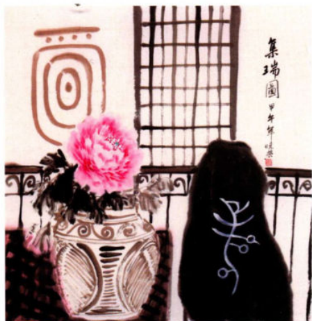
集瑞图 2014年 纸本设色 68cm × 68cm