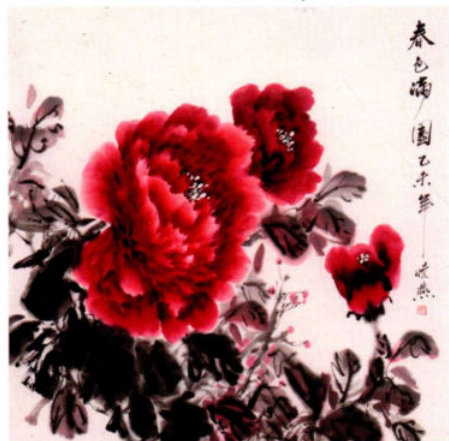
春色满园 2015年 纸本设色 68cm × 68cm