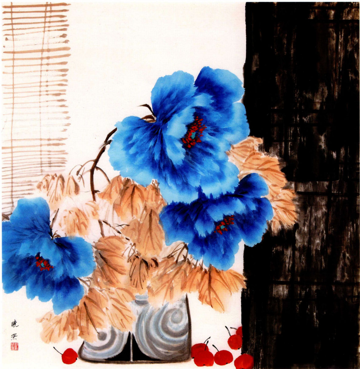
悠悠岁月 2018年 纸本设色 68cm × 68cm

不释手，因而画作中充满了柔婉深厚的书卷气息。《芸窗清供》里，赭墨古陶与牡丹的组合，配以零星散落的红果，看似无意的点缀，实则丰富了内涵也平衡了视觉，在竹编拢帘的轩窗下，充盈的是舒雅清新的人文格调和“芸牕相守，奋志诗书”的孜孜求索。她的画是在兼容并蓄中创新，有着自己独特的笔墨语言，在创作过程中也融进了许多西画的元素，从而使花朵的色调格外美观和谐，更加雍容富丽。而花蕊的细节处理，簇簇以繁杂的复色呈现，疏密聚散间，泛出