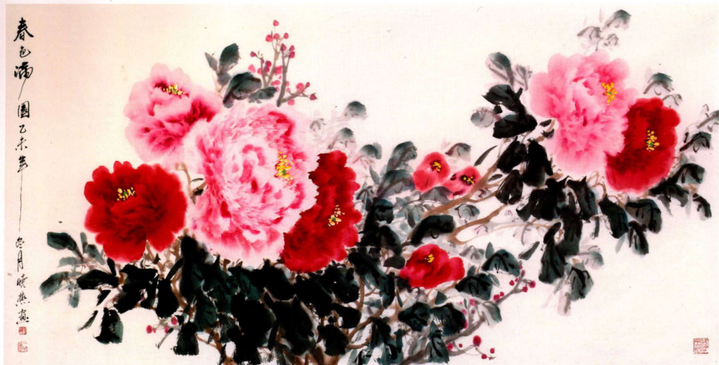
春色滿園圖之五 2015年 紙本設色 68cm × 136cm