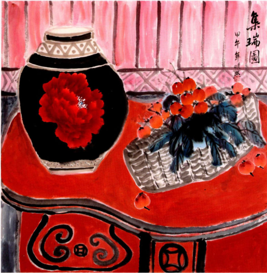
集瑞图之一 2014年 纸本设色 68cm × 68cm