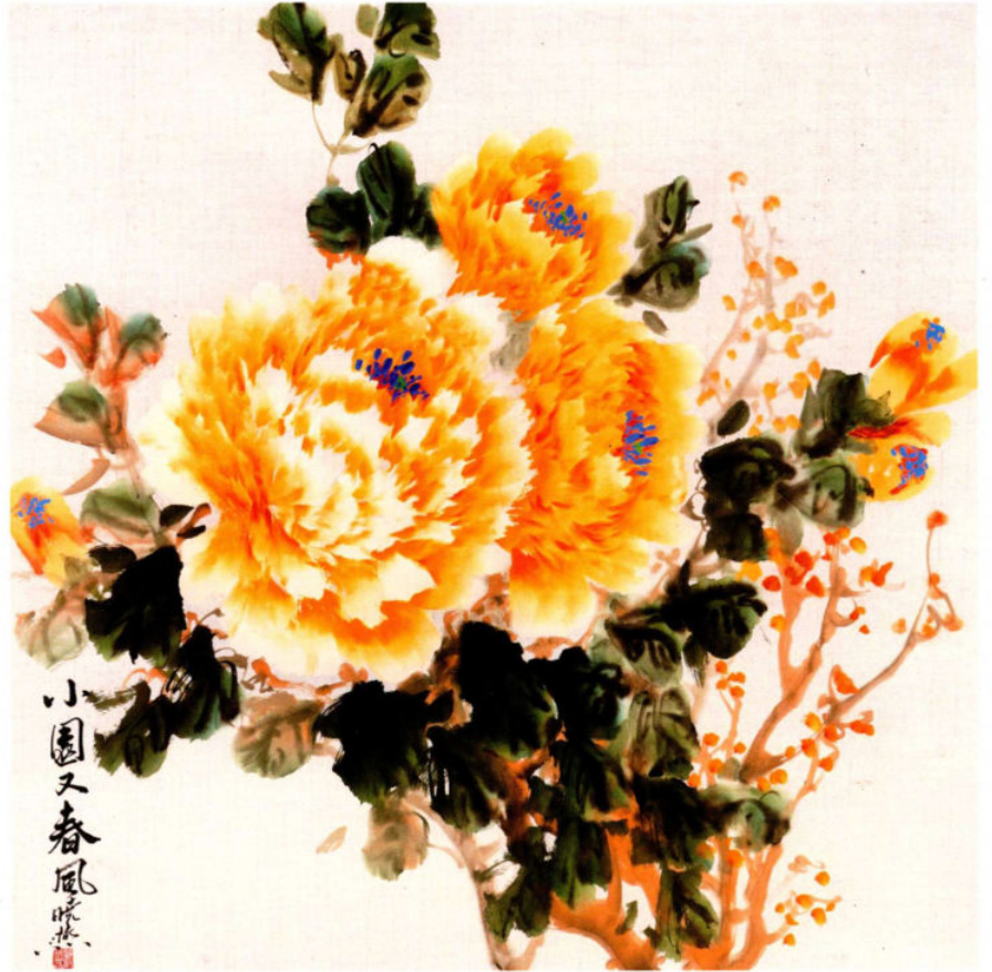
小园又春风 2016年 纸本设色 68cm × 68cm