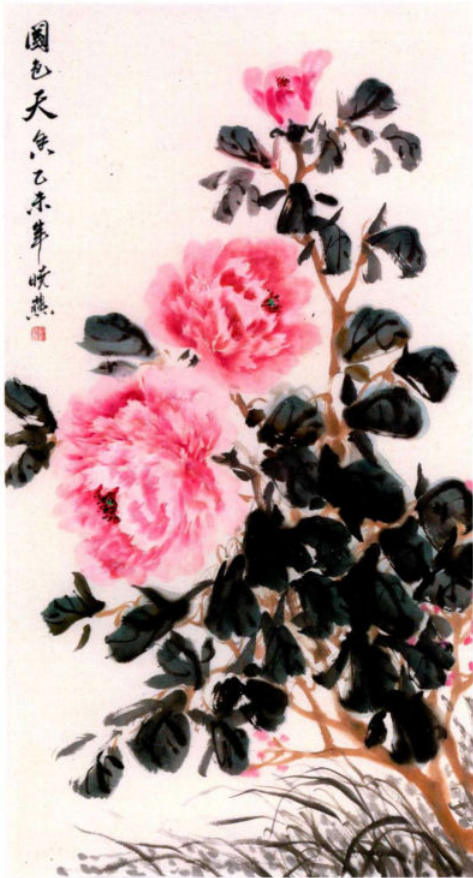
国色天香 2015年 纸本设色 90cm × 45cm