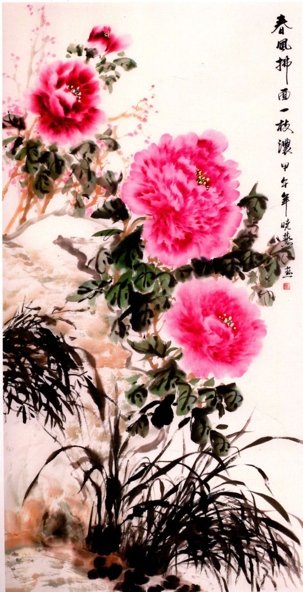
春风拂面一枝浓之一 2014年 纸本设色 136cm x 68cm