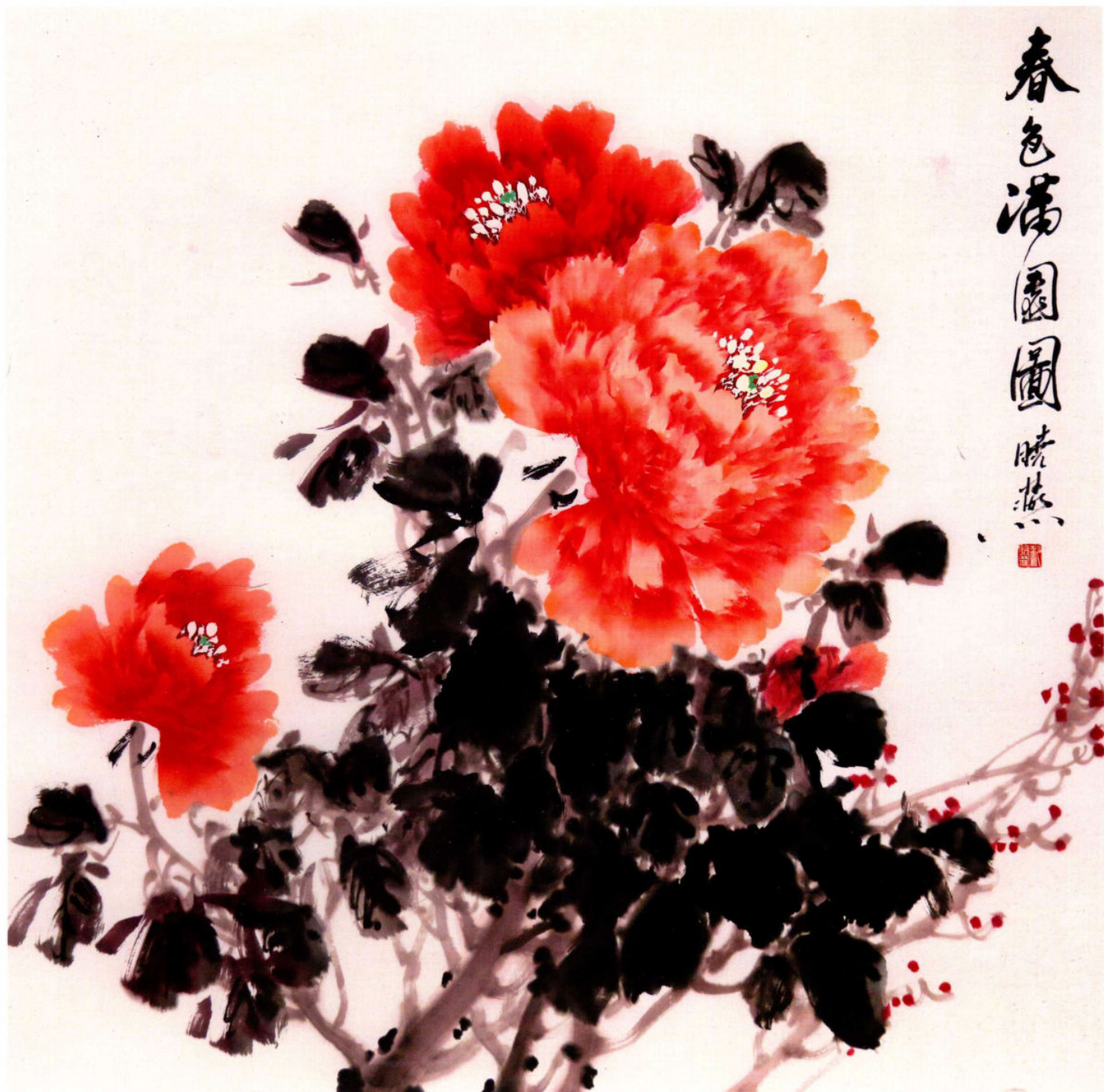
春色满园图之一 2018年 纸本设色 68cm × 68cm