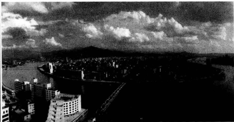
梅州新貌（市区全景）

物、辈出的英才、丰富的美食、驰名的客都等七个方面，对作为国家历史文化名城的梅州做个概略的介绍。当然，梅州的历史文化，远不止这七个方面。