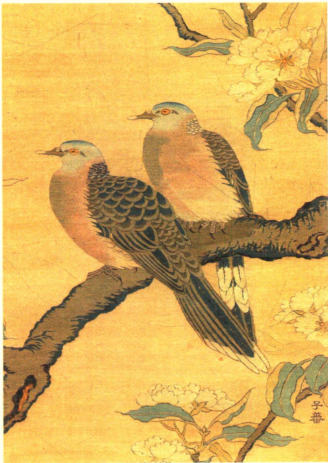
宋·沈子蕃缂丝花鸟（局部）