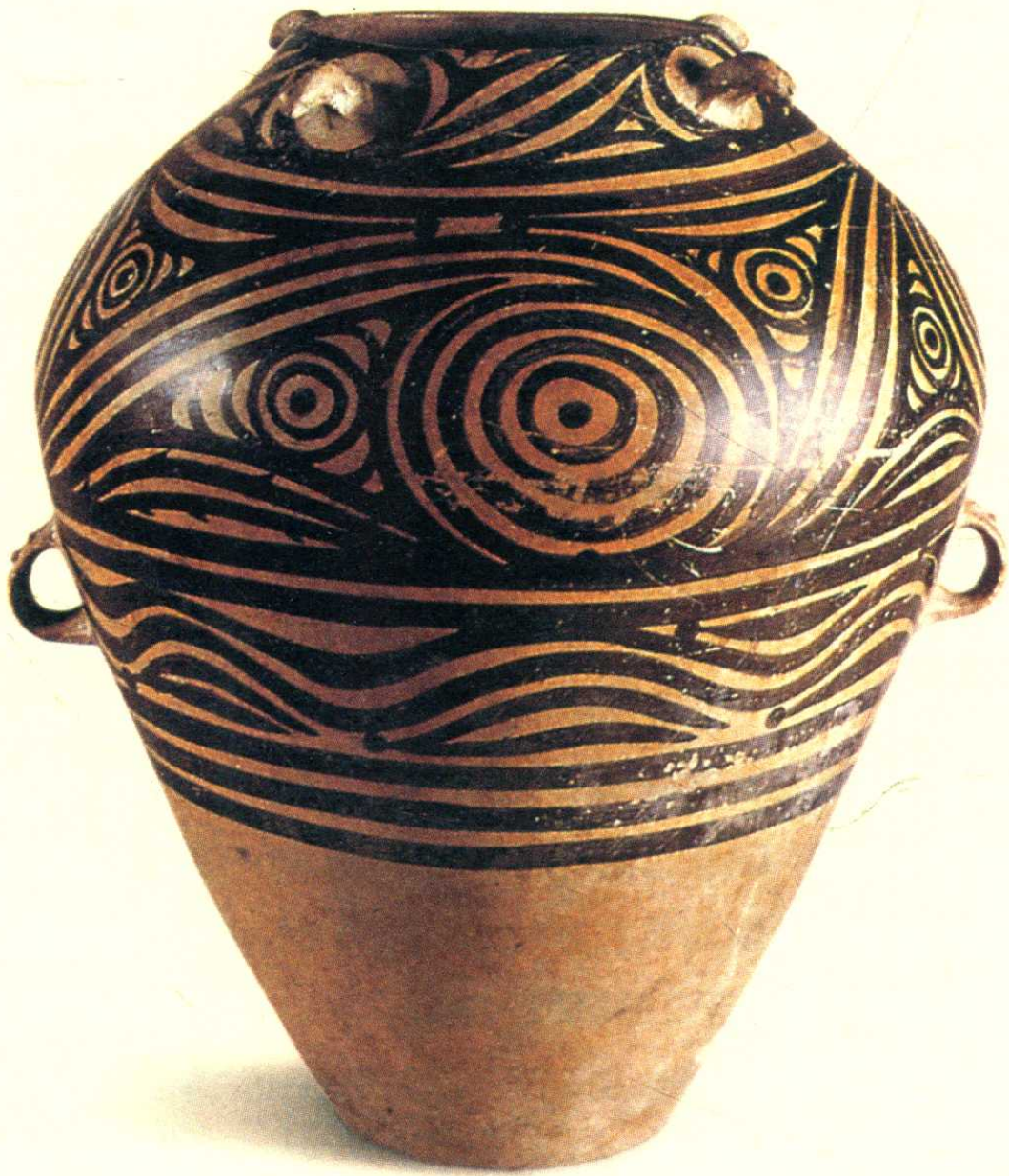
新石器时代·马家窑旋涡纹彩陶瓮