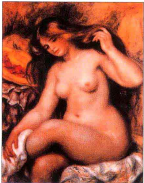
金发浴女 雷诺阿（法国） 布上油画92厘米×73厘米 维也纳奥地利美术馆藏