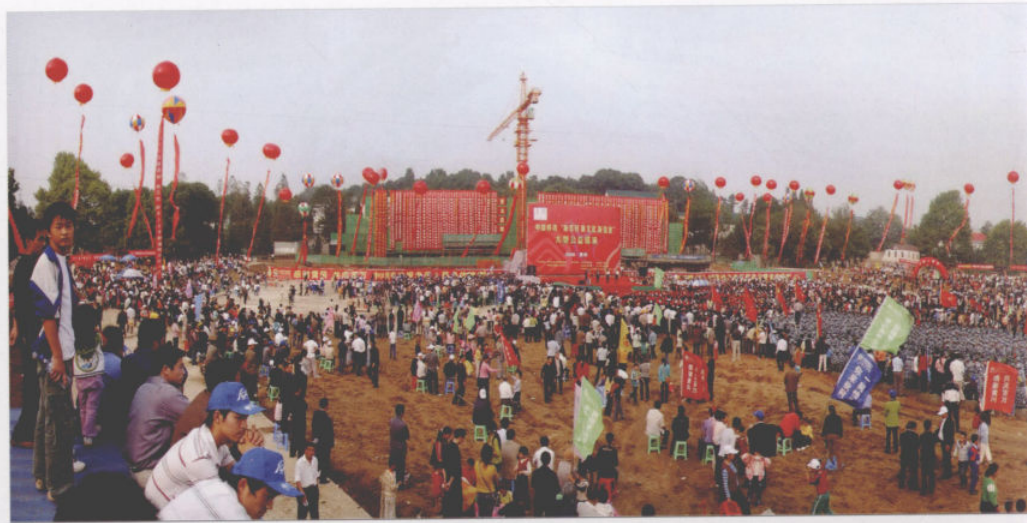
老区新事