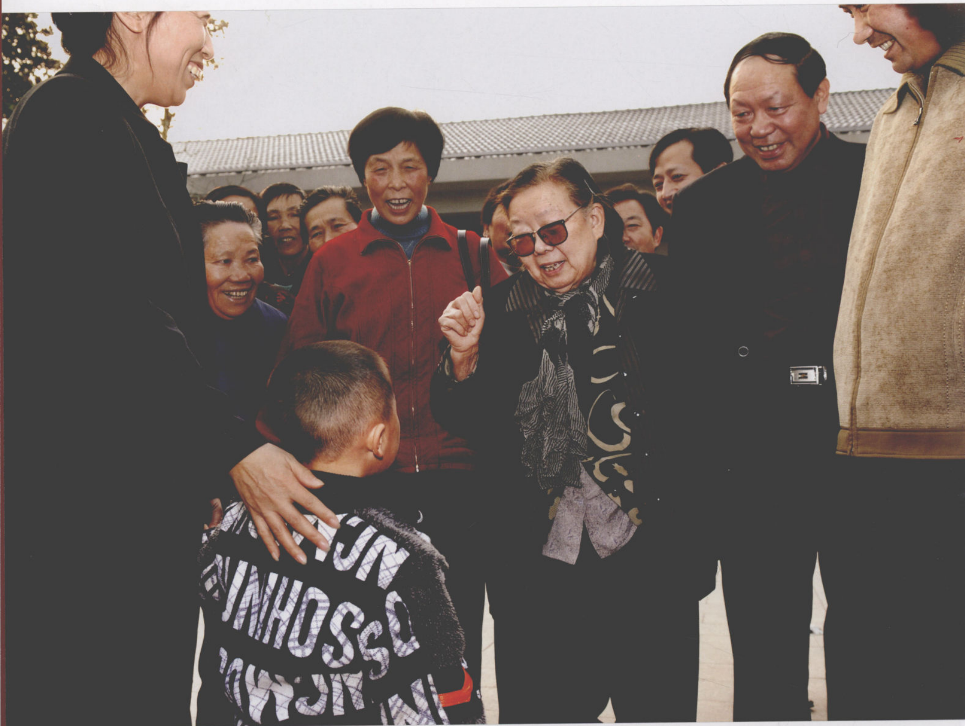
“希望在你们身上”（李先念夫人林佳楣回乡视察）