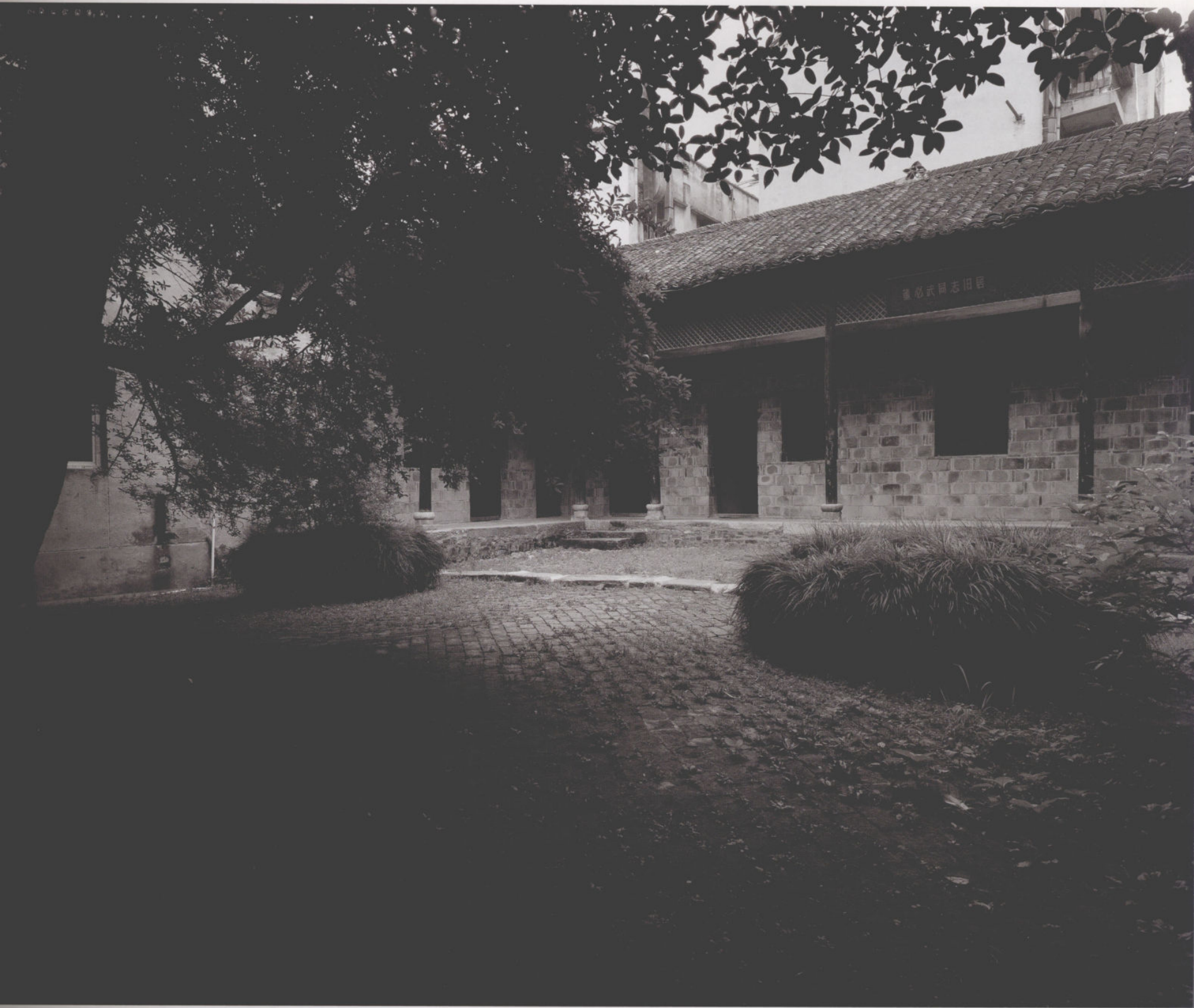
雅风依旧（董必武同志旧居）