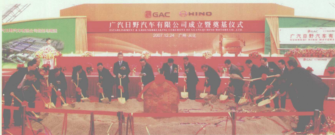
2007年12月24日，广汽集团与日野公司共同投资组建的卡车生产销售合资公司——广汽日野汽车有限公司，在明珠工业园举行奠基仪式。