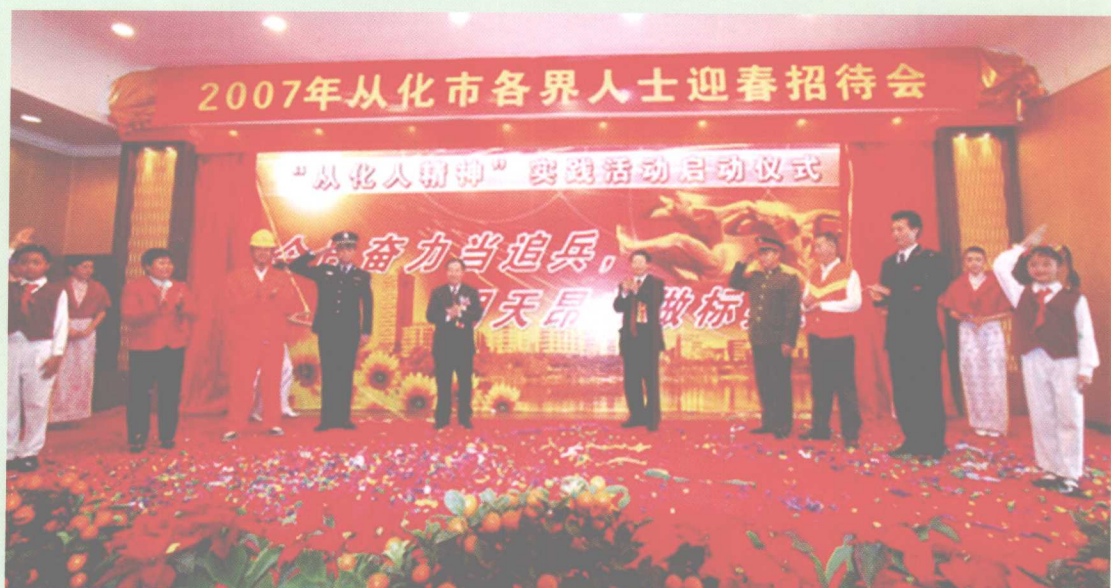
2007年月9日,“从化人精神”实践活动启动。