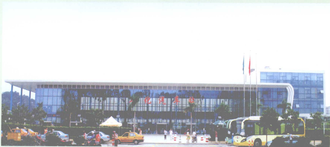
2007年9月12日，从化汽车站投入运营。