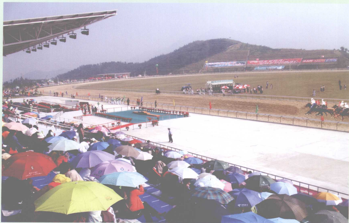
2007年11月12—17日，第八届全国少数民族传统体育运动会马术比赛项目在从化举行。