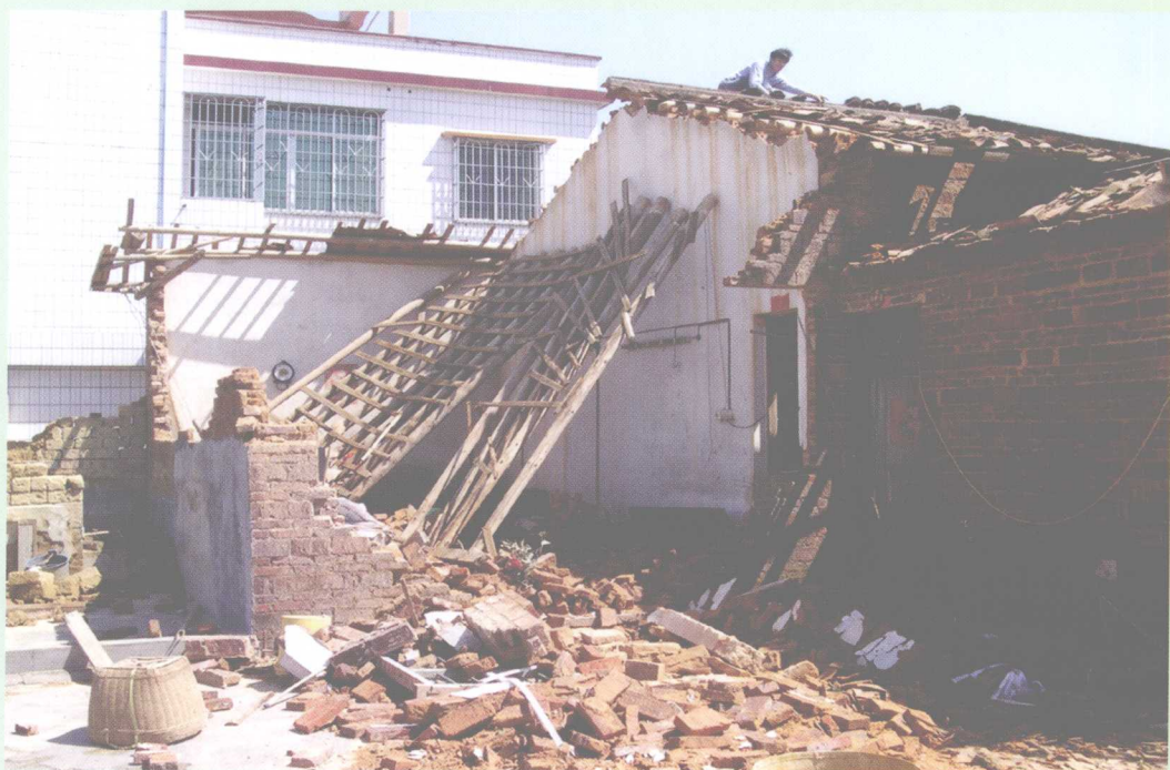
2007年4月17日，鳌头镇遭受12级大风突袭，吹倒公路两旁绿化树5公里，损坏房屋1798间，受灾4000多人。