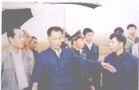
1985 年，省委书记林若（左二）到从化办造林绿化示范点。