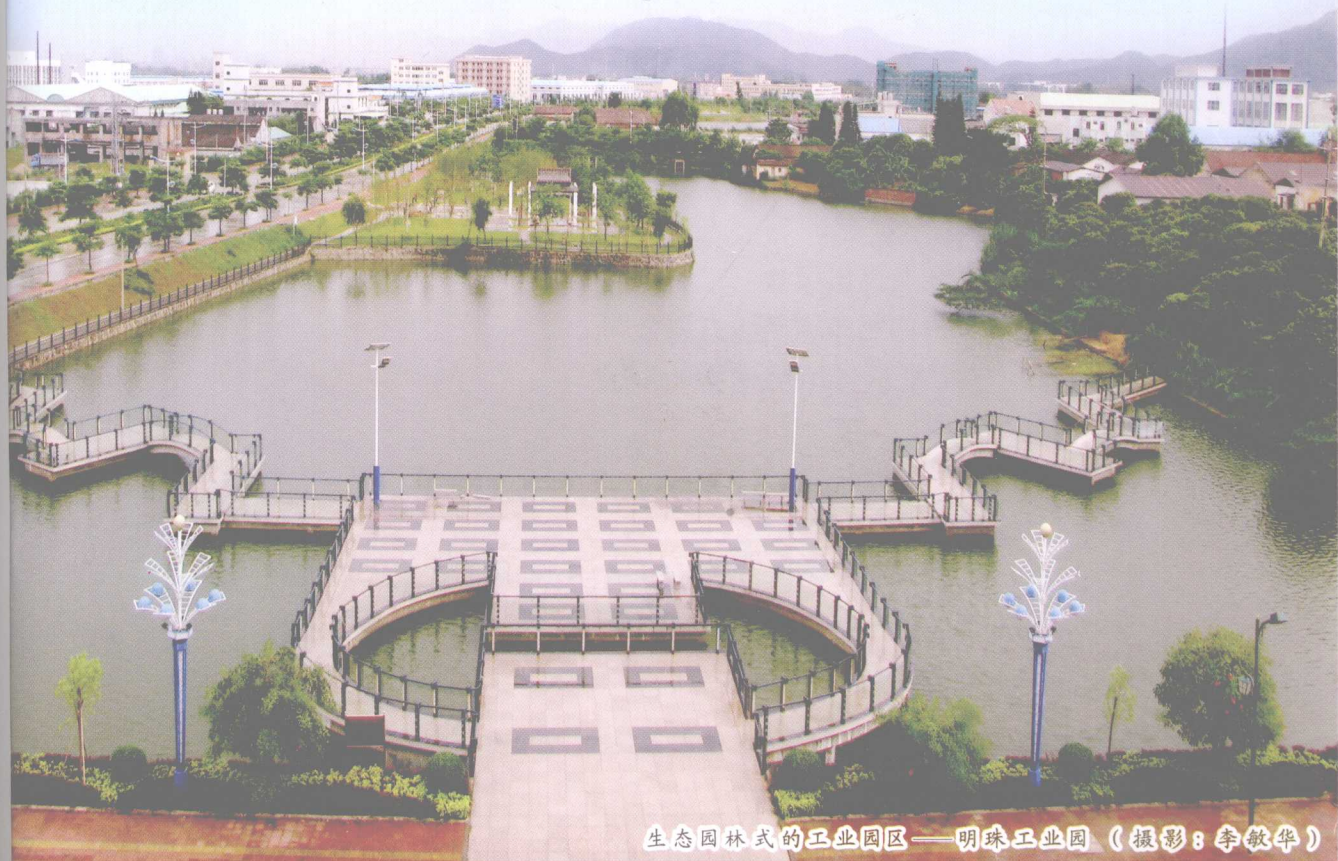
生态园林式的工业园区——明珠工业园