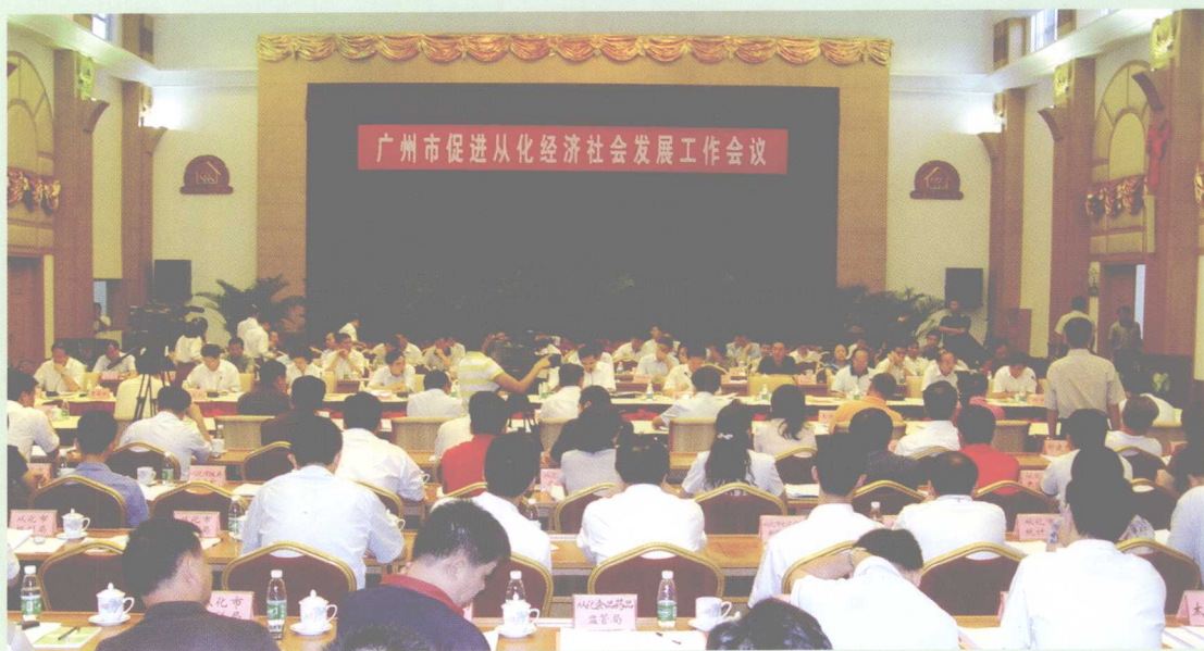
2007年9月12日，广州市委、市政府在从化温泉宾馆召开广州市促进从化经济社会发展工作会议。