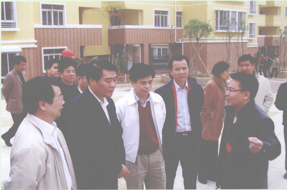
2007年3月13日，广东省委副书记欧广源到从化调研“三农”问题，广州市委副书记张桂芳及从化市领导欧阳知等陪同。