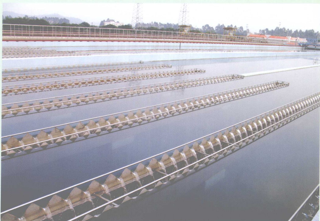
2007年4月，市第三水厂二期扩容工程建成投产，日供水量12万立方米，可满足近35万人用水。