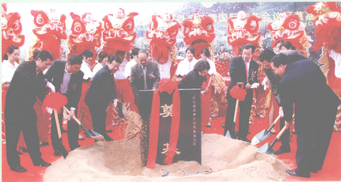
2007年12月28日，从化温泉养生谷会议区在良口举行奠基仪式。