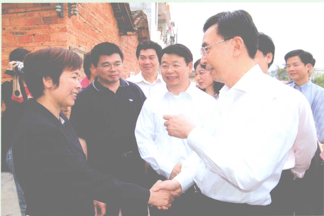
2007年4月26日，广州市委书记、广州市人大常委会主任朱小丹到从化调研，广州市委常委、秘书长凌伟宪，广州市委常委、常务副市长邬毅敏及从化市领导欧阳知等陪同。