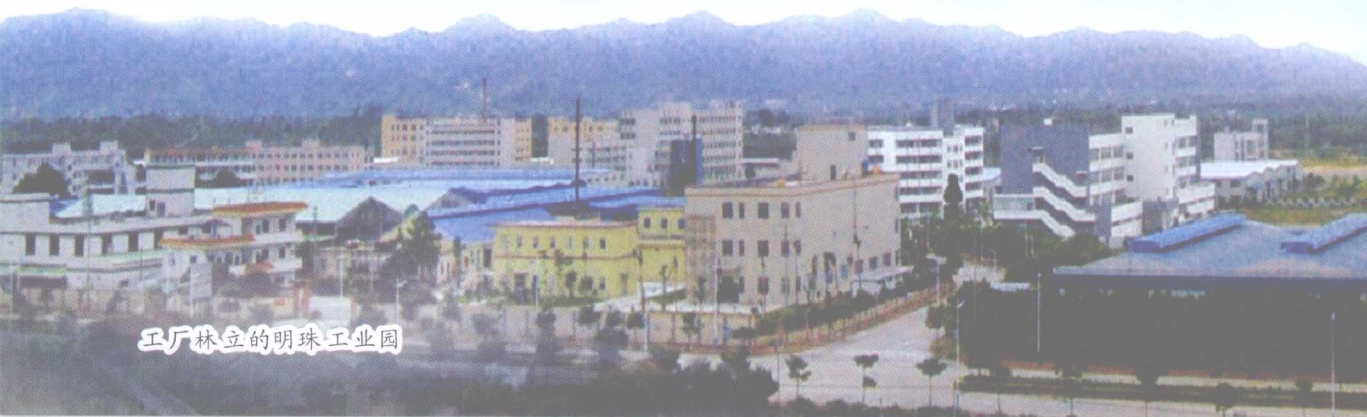
工厂林立的明珠工业园