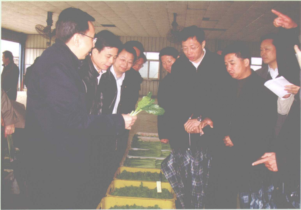
2007年3月7日，中共广东省委常委、广州市委书记、广州市人大常委会主任朱小丹，广州市委副书记张桂芳，市委常委凌伟宪，副市长陈国到从化调研，从化市领导欧阳知、梁建清、李玉宜、谭凯平、李艳阳等陪同。