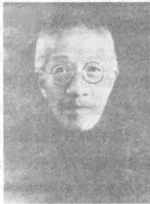
章太炎 (1869—1936) 近代著名学者

即本国固有的学术文化。 胡适认为，“国故”包含中国过去的一切历史与文化，既包含“国粹”，也包含“国渣”。研究这些历史与文化的学问，就叫“国故学”。