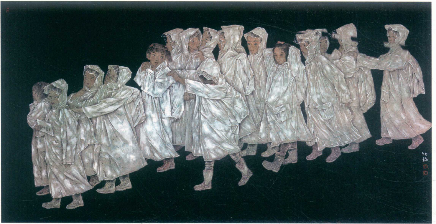
春雨 / 90cm x 172cm / 国画 / 一等奖