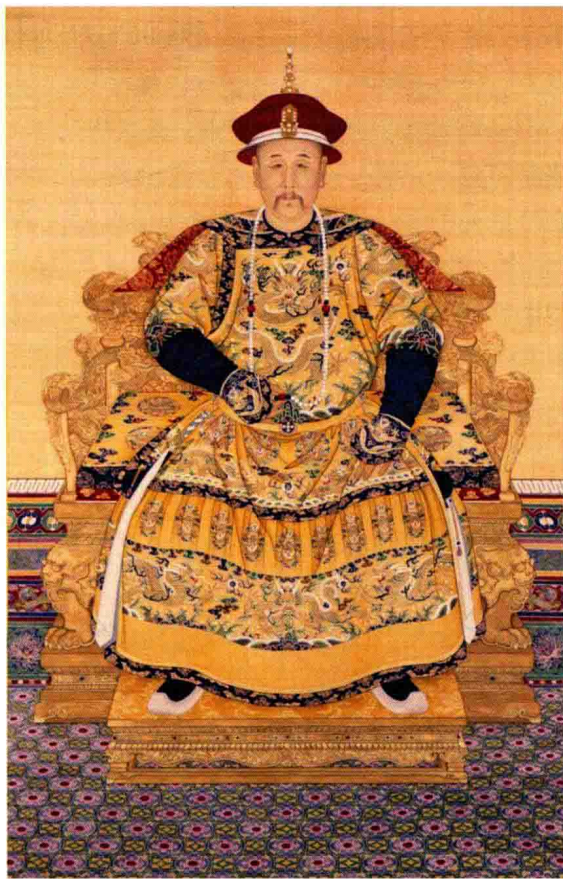
图 1-1 雍正画像，郎世宁，18 世纪

史，或者，由于这个代表性和述说功能而被艺术家引入艺术作品中，如绘画、雕塑、装置等。