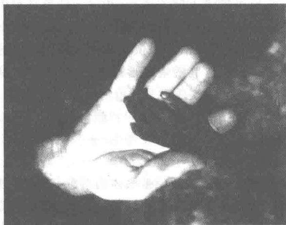
图 1-1 “乌干达旱灾的恶果”

(1) 以思想表现内容。任何好的摄影作品,都是摄影者思想的反映,是存在于头脑中的审美意识通过一定的物质材料而获得的体现。有什么样的思想,有什么样的审美意识,便可得到什么样的作品。也可以说,摄影作品记录的是作者对现实生活、社会现象审美感受的视觉表现。这种表现如果通过传播,它的内涵将对读者的思想情绪和感受产生极大的影响。如图1-1“乌干达旱灾的恶果”和图1-2“妈妈的吻”,这两幅作品虽然都没有宏大的场面和具体的人物形象,但会使人们产生强烈的视觉感受。所以,摄影者的思想意识、文学修养、艺术修养是摄影者创作摄影作品的基础。