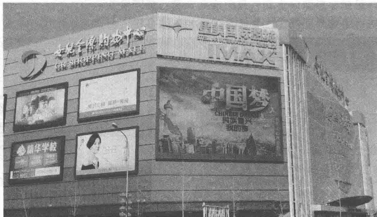
图 1-2 北京 LED 显示屏广告