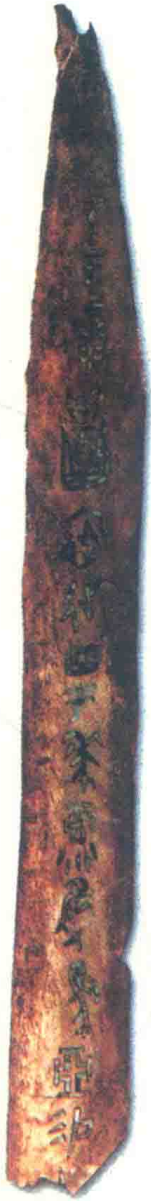
圖版一：安陽殷墟大墓出土骨片