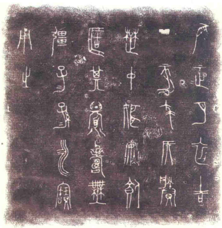
圖版六：復旦大學博物館藏楚仲姬炫簠銘文