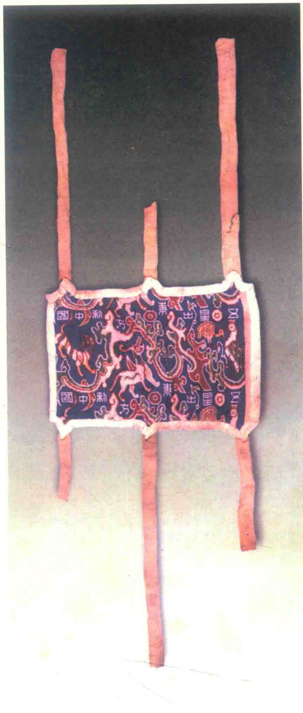
圖版七：尼雅出土織錦臂鞞