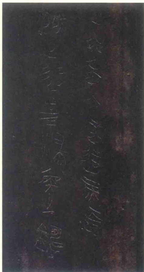
圖版四：首陽齋藏商鞅鉞