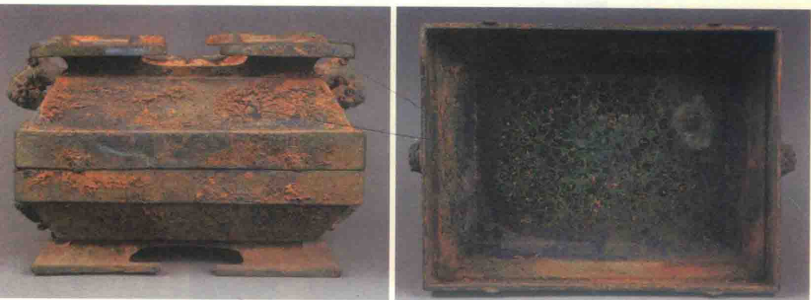
圖版五：復旦大學博物館藏楚仲姬炫簠