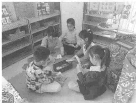
幼儿创作剪纸作品