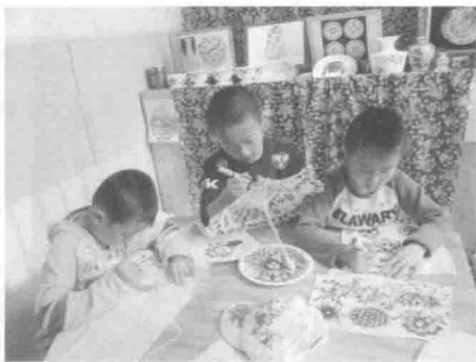
孩子们在手绢、雨伞、衣服等物品上 装饰自己喜欢的花纹与图案