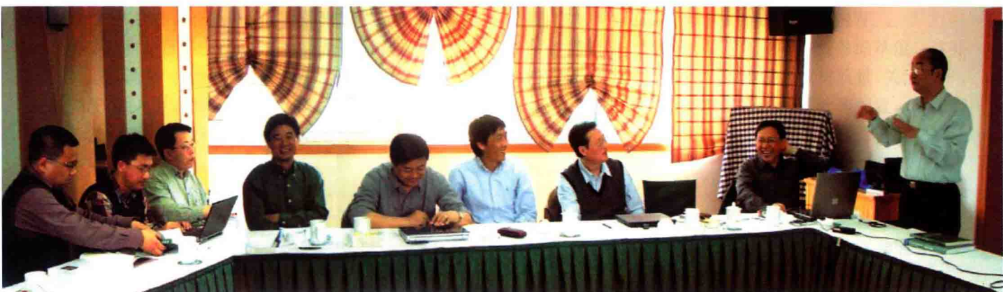
参加《免疫学原理》定稿会的部分作者和编者