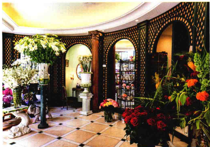
△年前搬来此处的这个位于巴黎第八区的店面，满满陈列着被预定的花束，等待配送到客人手中，从后方还不断搬出新制作完成的花束。