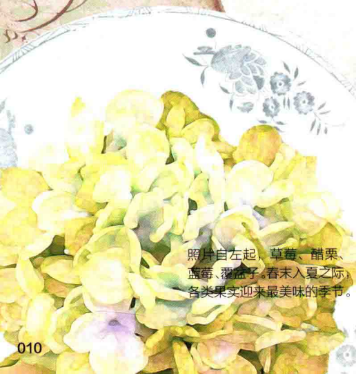
照片自左起，草莓、醋栗、蓝莓、覆盆子。春未入夏之际，各类果实迎来最美味的季节。