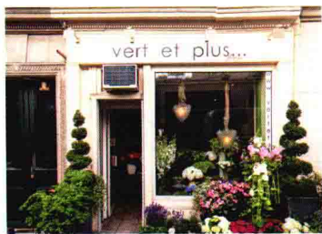
Vert et Plus... 14, rue Saint-Roch 75001 Paris Tel: 01 40 20 42 80 周一~周六 09:00-19:00