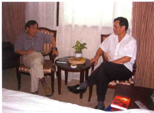
2005年葛剑雄教授(左)和陆运高的合影 (葛剑雄：中国著名历史地理学家、复旦大学教授)