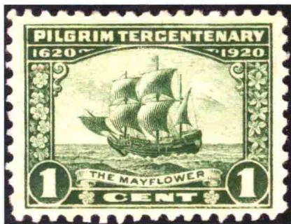
纪念1620年清教徒登陆美洲的“五月花号”船的邮票

伟大的美国人民通过美国历史昭告世界，美国的伟大，美国的成功，“五月花号精神”是最重要的原因之一。