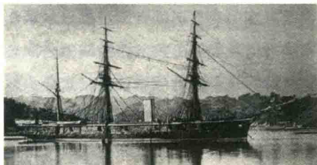
日军“比叻”号巡洋舰