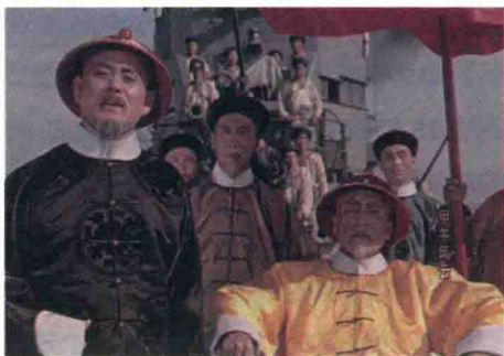
《甲午风云》电影截图