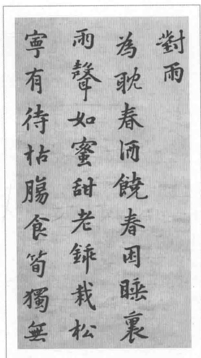
元 张雨 《为孔昭书四诗》

张雨（1277—1348）字伯雨，号句曲外史，别号贞居真人，钱塘（今浙江杭州）人。书法赵孟、李邕，骏爽清遒。高启称：“贞居早学书于赵文敏，后得《茅山碑》，其体遂变，故字画清遒，有唐人风格。”