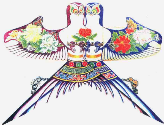
图 1-1-2 沙燕风筝之比翼燕

北京风筝也称宫廷风筝,具有雍容华贵、扎制精致、彩绘精美等艺术特点。北京风筝主要代表是哈氏风筝和曹氏风筝,著名文学家曹雪芹创设了曹氏风筝艺术,还编著了《南鹞北鸢考工志》一书(倪宝诚,2002)。沙燕风筝为北京风筝的典型代表,沙燕即“飞燕”,是以燕子的形态为创作原形,作夸张变形装饰设计。沙燕风筝分肥燕(代表男性)、瘦燕(代表女性)、比翼燕(代表夫妻)(图 1-1-2)、雏燕(代表孩童)(图 1-1-3)四种类型。沙燕具有起飞比较平稳的特点,通常儿童放飞的风筝中以“沙燕”形式居多。