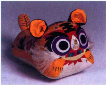
图 1-1-5 布老虎

布老虎是最具代表性的布玩具。按旧俗,端午节期间,民间盛行给孩子送布老虎。布老虎具有驱邪辟崇、迎祥纳福的功用,同时传递着爱和祝福。布老虎的造型头大、身小,五官集中,其神态稚气,体态憨拙,流露着孩子般虎头虎脑的微妙之态,惹人喜爱,如图 1-1-5 所示。布老虎形式多样,有单头虎、双头虎、四头虎、母子虎、套虎、枕头虎等。通常