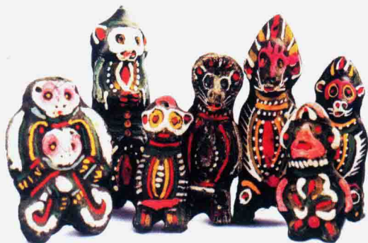
图 1-1-9 淮阳人面猴