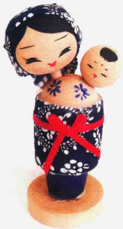
图 1-1-14 车木玩具《母与子》

浙江温州的泰顺县地处山区,木材资源丰富,盛产小杂木、松树等。泰顺的民间艺人利用当地优势开发了一系列木制玩具产品,其中车木玩具最具民族风格和地域特色。泰