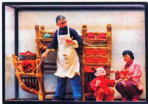
图 1-1-11 王锦荣《民间三十六行》中的馄饨担

近年来,温州米塑在继承传统的基础上,拓展了以表现民俗题材为主的艺术新路,并把重点转移到实用性上,例如,王锦荣大师的代表作《民间三十六行》系列米塑作品(图 1-1-11)、《温州年夜饭》(图 1-1-12)等。