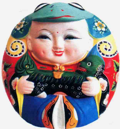
图 1-1-7 惠山泥人大阿福

江苏无锡惠山泥人相传始于明代,已有四百余年历史,是一门土生土长的民间艺术。惠山山脚下独特的黑泥,具有质地细腻、柔软,可塑性极强的特点,经艺人们世代实践,形成了惠山泥人的独特风格。惠山泥人有粗货和细货之分,粗货又称“耍货”,多为儿童玩具,采用模具印坯,手工绘彩。其造型粗犷,色彩明快,形神兼备;内容大多以喜庆吉祥题材为主,例如大阿福、蚕猫、青牛、车状元、车老翁等。