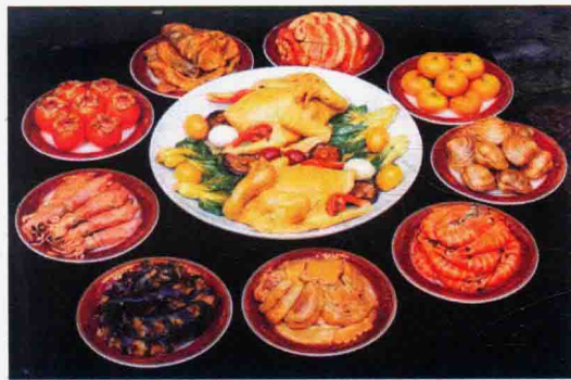
图 1-1-12 王锦荣《温州年夜饭》