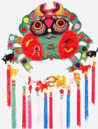
图 1-1-4 “五毒”香包

端午节是农历五月初五,在民间流传最广泛的说法就是为了纪念古代伟大的爱国主义诗人屈原。端午节有吃粽子、赛龙舟、挂蒲插艾、玩布老虎、挂香包、撞蛋等习俗,香包和布老虎都是端午节的节令玩具。