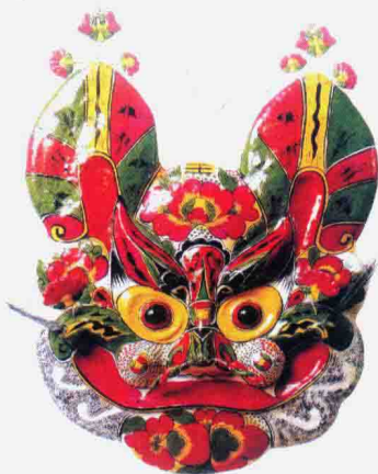
图 1-1-8 凤翔虎头挂片

河南淮阳泥泥狗造型怪诞、古拙,充满着超脱的神秘感。泥泥狗的成型方法大多是手捏法,只有极少数采用单片模子翻印。它的上色采用成批“浸染”的方法,先将泥胎染成黑色,放在草席上晾干,接着用一根削尖的高粱秸蘸白、红、黄、绿等颜色逐个彩绘。其装饰纹样是一些生殖器官的抽象符号,由点和线组成,表达着繁衍生息的内涵,蕴含着对原始图腾文化的崇拜。泥泥狗表现的内容多为奇禽怪兽,其中以泥猴的造型最为丰富,最有代表性的是“人祖猴”,又称“人面猴”,如图 1-1-9 所示。整体形象庄严而神圣,其造型似人又似猴,头顶做桃形装饰,胸部装饰纹样绘有女性生殖器的抽象符号,这是上古时代对生殖崇拜的遗存。