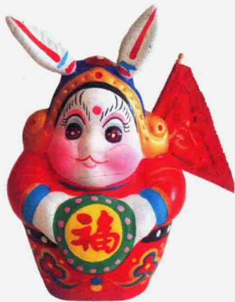
图 1-1-6 北京的兔儿爷

兔儿爷是兔面人身、一副武将装束的彩绘泥塑玩具,它是老北京中秋节的节令玩具。兔儿爷起源明代,盛行于清代。兔儿爷的花色品种繁多,身穿盔甲和战袍,手握捣药杵,背插靠旗。通常以坐骑的形式出现,有骑虎、骑麒麟,骑鹿、骑象等。关于兔儿爷还有一个美丽的传说,有一年,北京城里忽然闹起了瘟疫,每户人家都有人生病,吃什么药都不见好转。嫦娥目睹百姓苦难,就派玉兔到人间为百姓祛灾治病。为纪念玉兔给人间带来的吉祥和幸福,人们便用泥塑造了它的形象。每年农历八月十五的晚上,家家户户都在一张八仙桌上摆放兔儿爷,供以瓜果、月饼等,祭拜月神。兔儿爷专供儿童祭月之用,供奉完了之后就成为孩子的玩具,这也是唯一一个能拿在手里玩的“神仙”。为了增强兔儿爷的可玩性,耳朵和靠旗的设计都是灵活可动的,如图 1-1-6 所示。有的牵线操纵可使手臂活动,同时还出现了“兔儿奶奶”的造型。