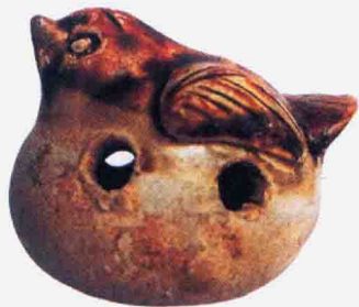
图 1-1-1 青釉黄褐彩鸟形哨

玩具是一种使人们精神愉悦的娱乐器具,俗称“耍货”“玩意儿”等,主要对象是儿童。长期以来,玩具往往被人看成“小玩意儿”而不加重视,然而出土的实物史料证实了我国玩具的历史源远流长。早在新石器时代,就出现了陶做的“玩意儿”。例如,河南仰韶文化遗址出土的石球和陶球,浙江河姆渡文化遗址出土的陶狗、骨笛(哨),山东大汶口文化遗址出土的陶猪等,可以说是迄今我国发现最原始的玩具。这些玩具以塑形玩具为主,大多取材于当时的生产活动。在汉代,泥车、瓦狗等塑形玩具相当成熟,也有木玩具、布玩具的雏形,还出现了专门以制作玩具为职业的艺人。隋唐时期,民间玩具的品种丰富,其中陶、瓷质玩具达到了较高的生产水平,如图 1-1-1 所示。宋代是民间玩具的鼎盛期,最具有代表性的是节令玩具磨喝乐。在宋代绘画作品中可以看出当时的儿童生活,尤其在李嵩的《货郎图》中可以看到货担上的玩具琳琅满目,有风筝、拨浪鼓、风车、香包、泥娃娃、竹蛇等,孩子们欢呼雀跃,可见其喜爱程度(王连海,2006)。明清的民间玩具在继承的基础上,技艺不断提高,形制更加精致,是成熟与稳定的历史时期。