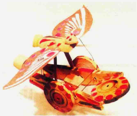
图 1-1-13 山东木鸟车

山东郯城县樊埝村生产各类木制玩具,大多用旋床车削而成,其中高低木棒娃娃最具代表性。木棒人的制作通常以杨柳、泡桐为材料,风干、去皮之后,以木材的原始形状圆柱形为基础,车削成长而细或短而粗的毛胚,再组装一个可活动旋转的头,然后上底色,施彩绘。木棒人坚固耐玩,柱体身躯,没有四肢,头可旋转,滑稽有趣,一般都是一男一女、一高一低、一胖一瘦。还会制作木刀头和玩具车等玩具,例如砍刀、大刀头、枪头等各种木刀头,木刀头的下面装上一根竹棍或木棒作为刀柄,就是孩子们玩打仗游戏的武器。还有打鼓车、木鸟车(图 1-1-13)等玩具车,随着车轮推动,小人会两臂分合作钹击状,小鸟就会扇动翅膀,深受儿童的喜爱。