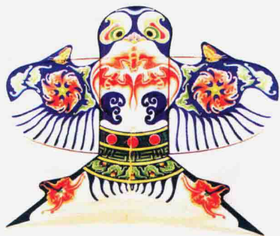
图 1-1-3 沙燕风筝之雏燕