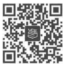
教学录像 1-2 品德及其特点

品德与道德是两个有区别的概念。首先，道德是社会现象，其发生、发展符合社会发展规律；而品德的内容虽然具有社会性，但因其是一种个人的心理特征，其形成与发展除了受社会发展规律的制约外，还要受个体生理、心理发展规律的制约。例如，儿童道德判断、道德推理的发展与其思维能力