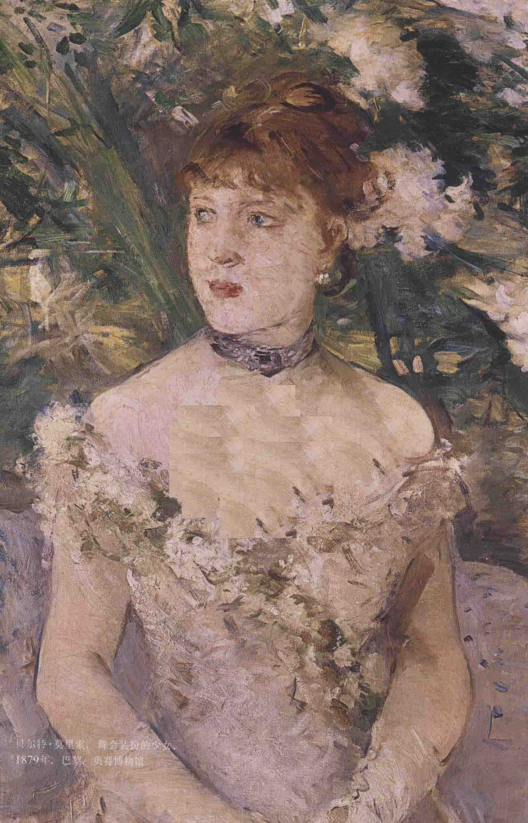
贝尔特·莫里索，舞会装扮的少女 1879年，巴黎，奥赛博物馆