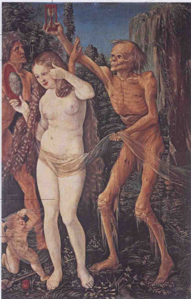
▲ 汉斯·巴尔东·格里恩 (Hans Baldung Grien), 《三个生命阶段与死亡》(Le tre età e la morte), 1510年, 维也纳, 艺术史博物馆