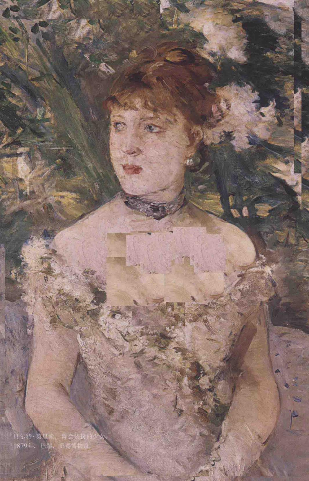
贝尔特·莫里索，舞会装扮的少女 1879年，巴黎，奥赛博物馆