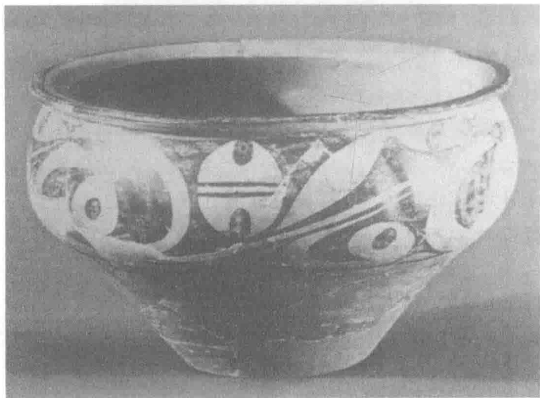
图 1-1 仰韶文化庙底沟遗址玫瑰花卉图案彩陶盆

们中华民族史前史全部都概括进去了。这个“华人”的“华”本是“花”的意思，这个“花”是什么样的花呢？是一种玫瑰花，如图 1-1 庙底沟文化彩陶上的玫瑰花图案，那真是神来之笔。我们可以思考并联想，可用这个“花”来象征并指代什么呢？它可以象征中华史前农业的历程，玫瑰花本就是一种植物。可以说由“花”到“华”，包含了我们整个中华文化的史前时代——旧石器时代以来，特别是新石器时代早、中、晚三个阶段，基本上是距今 5500 年以前的全部历史，也就是从伏羲到神农的时代，其中，单就新石器时代而言，就是经由“农业革命”所形成的农业时代，农业时代的根底就是植物，不管是野生植物还是人类所栽培的植物，这个“花”与“华”就是其代表与文化的象征。