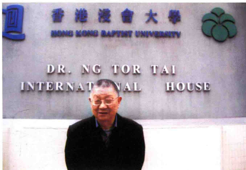
李今庸教授在香港浸会大学讲学期间留影