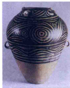
旋涡纹彩陶瓮 马家窑