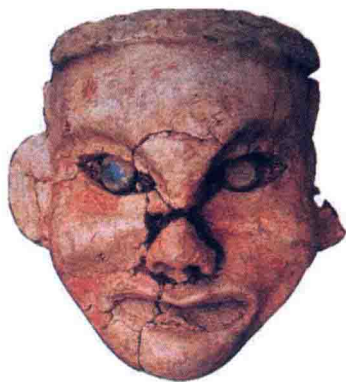
泥塑女神头像 红山文化

以 1971 年在内蒙古自治区翁牛特旗三星他拉村出土的红山文化碧玉龙、1986—1987 年在浙江余杭反山良渚文化墓地出土的透雕神人玉冠饰、安徽含山凌家滩出土的玉雕人像等最为出色。三