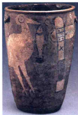
鹤鱼石斧图彩陶缸 庙底沟