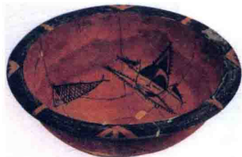
人面鱼纹彩陶盆 半坡型