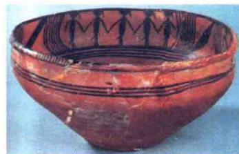
舞蹈纹彩陶盆 马家窑

A. 内彩四鹿纹盆：鹿均作侧视形象，在变化不大的躯体下，通过四条腿或前伸、或下垂、或前后伸展等不同画法，使它们各具不同的活泼姿态。