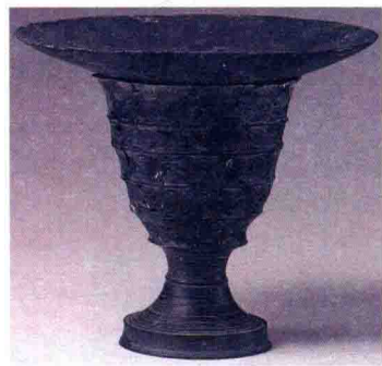
镂孔蛋壳黑陶杯 龙山文化

是在烧制结束时，从窑顶慢慢加水，木炭熄灭后产生浓烟，使陶器渗炭而成的，表面漆黑光亮且较为致密。黑陶工艺以造型见长，其特点是黑、薄、光、纽。山东龙山文化以轮制技术制成的薄胎蛋壳黑陶以器形别致、工艺精巧而著称。潍坊姚官庄出土的蛋壳黑陶盘口花柄圈足杯，轮廓曲折多变，造型稳健俊秀。