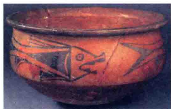
三鱼纹彩陶盆 半坡型

(1) 半坡型：施彩的陶器通常为圈底或平底钵、平底盆、鼓腹罐、细颈瓶等。花纹绘在陶器的口沿、器肩、上腹或敞口盆的内壁，花纹图案除有宽带、三角、斜线、波折等几何纹样外，还有相当发达的动物图案。出土地点有陕西西安半坡、临潼姜寨、宝鸡北首岭等遗址。