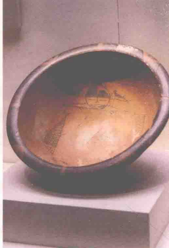
〔新石器时代〕仰韶文化《人面鱼纹彩陶盆》（约前4000），1954年在陕西西安半坡出土

结绳做记号，后来又改为用坚硬的利器刻画符号。仰韶文化中，彩陶盆上那人面含鱼、牵手舞蹈的图画，便是五六千年前最早的汉字雏形和书法的最初线条。这些“意符文字”或“图画文字”，起初差异很大，后来逐渐固定下来，统一起来。经历许多年，变得规范化和抽象化了。或横或竖或斜，或长或短，或连或分，都是直挺的线条，于是出现了中国最早的文字——甲骨文。