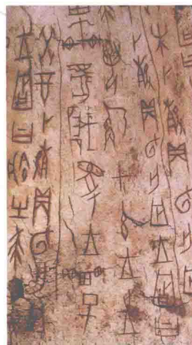
〔商〕《祭祀狩猎涂朱牛骨刻辞》（约前13世纪—前12世纪）。骨藏中国历史博物馆