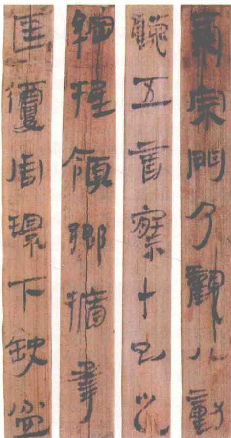
[汉]《马王堆三号汉墓简·合阴阳》(局部) (前168), 1973年在湖南长沙马王堆汉墓中出土

然而，无论是甲骨文，还是金文、石鼓文、诅楚文、简帛书，均出于部落首领或巫师、史官之手，具有明显的社会功利目的。他们无心于书而成书，不曾留下姓名。没想到无意插柳柳成荫。先秦