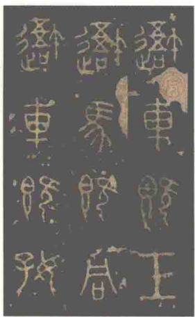
〔秦〕《石鼓文》（局部） （前777—前766），是我国 现存最早的刻石文字，原石 现藏北京故宫博物院。今见 最早善本为北宋拓本