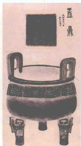
【西周】《大盂鼎铭》（局部）（前11世纪中叶），为西周前期金文典范。鼎现藏中国历史博物馆

多的一篇金文，是周宣王时的《毛公鼎铭》，共497字。其字体结构严整，瘦劲流畅，布局不弛不急，行止得当，是金文的代表作品。据记载，周宣王时期有太史籀试图统一文字。他变革金文书体，去芜存菁，作《史籀》15篇，作为当时学童的识字课本，也成为王室器物上使用的标准字体，人称“大篆”或“籀书”。其流风所及深深地影响到秦地的字体和书风。可惜，《史籀》传至东汉就已散失了6篇，余下9篇如今也已不存，仅东汉许慎《说文解字》中收录有200多个大篆字体。