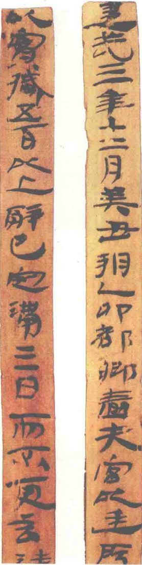
〔汉〕《居延简牍》（局部），为汉代张掖郡居延都尉等的文书

李斯（？—前208），字通古。他本是楚国上蔡（今河南上蔡西南）人，荀子的学生，后来到秦国做客卿，官至丞相。中国书法史上，李斯是第一位开宗立派的大家。他删除大篆之烦冗，取其合宜，创为小篆。所以，东汉许慎《说文解字·叙》中说：李斯“皆取史籀大篆或颇省改，所谓小篆者