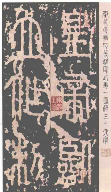
〔秦〕《泰山刻石》（局部）（前219），相传为丞相李斯手笔。现仅存碎石两片，在山东泰安岱庙。最多字的宋拓本有165字，现存日本

也”。这种标准化的官方的新书体，结体平衡对称，呈现曲线长形，或上密下疏，或上疏下密，稳定之中又见飘逸舒展；用笔圆起圆收，粗细一致，从容平和，劲健有力；章法上行列整齐，规矩和谐。所以，小篆结构的形式美异常突出，后人称之为“玉筋篆”。当年秦始皇多次亲率大臣到各郡县视察，登山临水，立碑刻石，为其一统天下歌功颂德。据说，泰山、峯山、琅琊台等处刻石上面的小篆，都是李斯所书。李斯所创立的小篆对后世影响很大。五代徐铉、唐代李阳冰、清代邓石如，近代吴昌硕都受其影响，以篆书见长，但小篆艺术成就