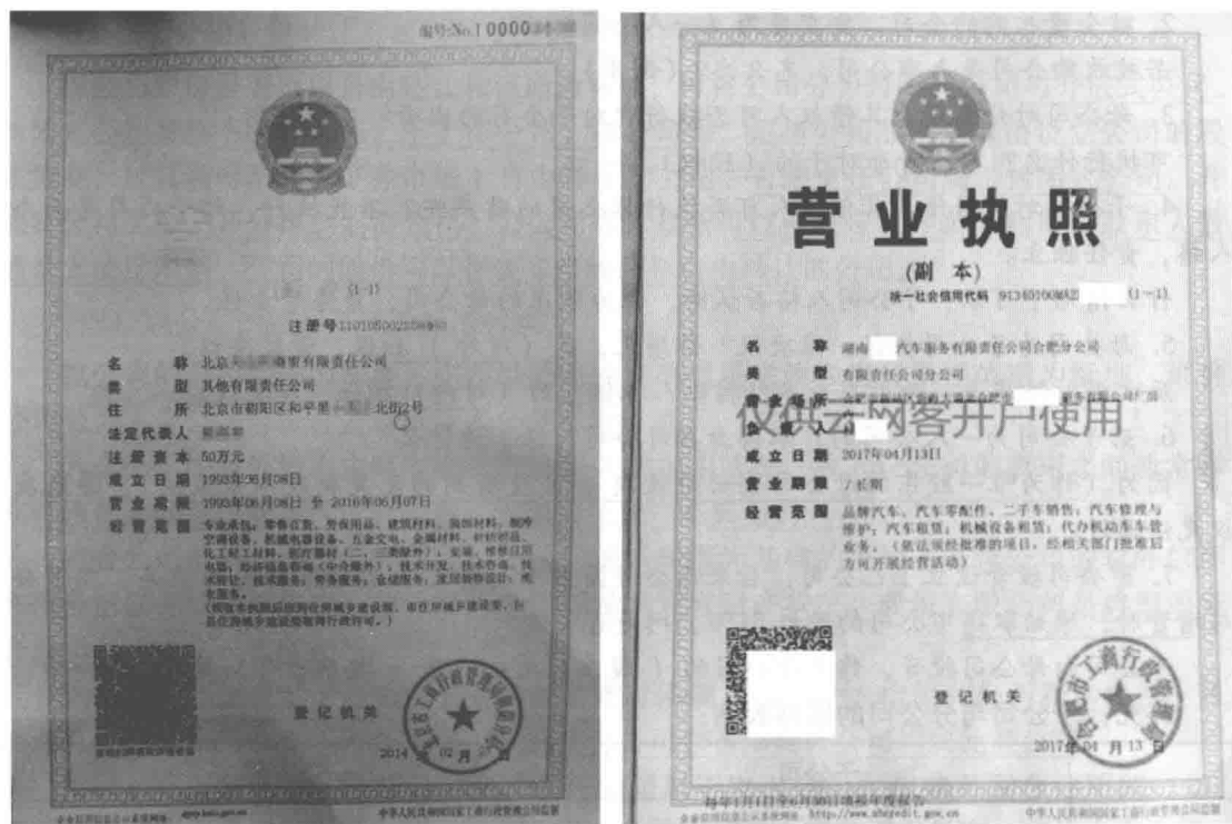
(上图为子公司与分公司执照的图例。)