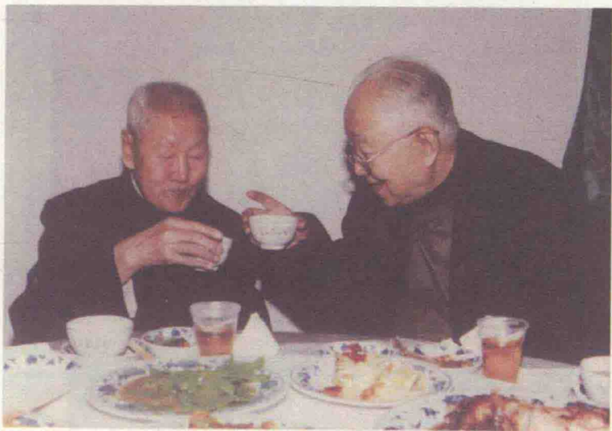
张中行先生与启功先生对饮