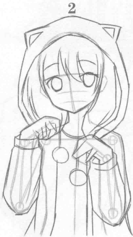
② 细化漫画人物的轮廓处理，处理好人物内部的相互关系。