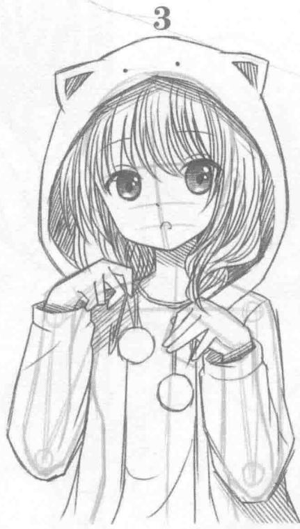
③ 绘制人物的阴影关系，以光感对人物进行更好的体现。

漫画中的人物往往显得十分修长、高挑，通常作者都会严格按照头身比例来进行创作，头身比例在后面的学习中也会为大家讲到，它是人物绘制中比较重要的部分。所以，在漫画中，完美的人物是创作的动力，作者们往往将现实不存在的或遐想的美好事物通过漫画形式表现。