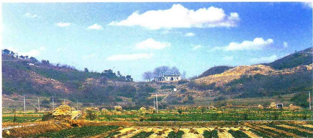
海宁黄湾灵泉乡之黄山