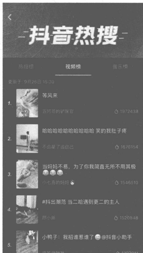
图1-2 抖音热搜的视频榜