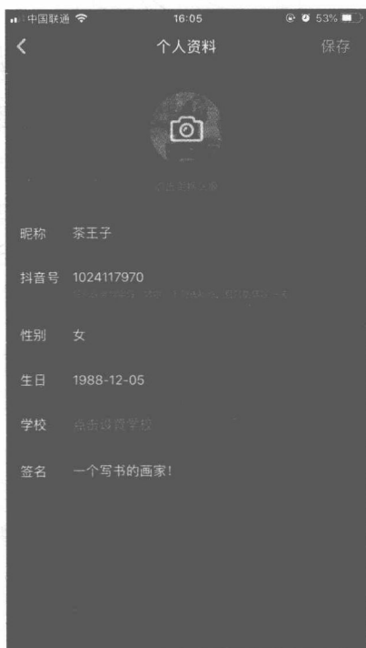
图1-3 抖音更换头像页面

在这里，你可以用相机拍摄也可以进入相册选择自己喜欢的图片，上传到抖音，成功更换头像。