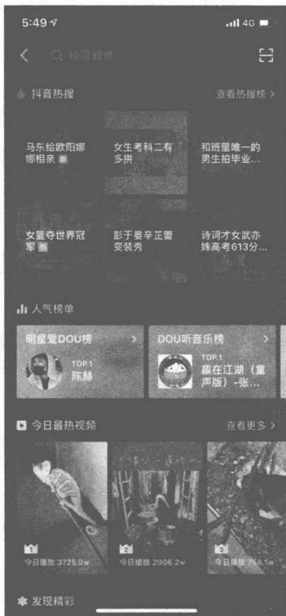
图1-1 打开抖音“搜索”页面