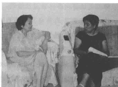
教育部第一任大学英语指导委员会主任，清华大学陆慈教授（左）