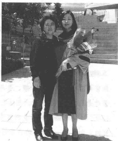
在 MIT 参加女儿博士毕业典礼与女儿合影