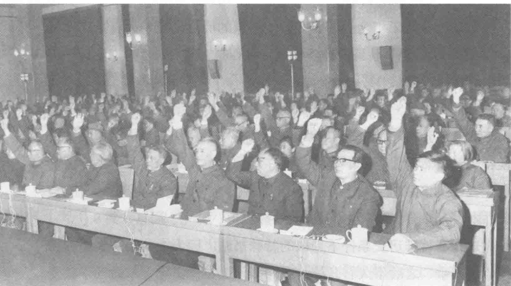
十一届三中全会会场

12月2日，邓小平约胡耀邦、胡乔木、于光远等在家中谈话，谈讲话稿的重新起草问题，并拿出了自己亲笔所写的讲话提纲。在重新起草和修改过程中，邓小平又与起草者谈话，逐条逐字地审阅，并亲自拟定讲话的题目。