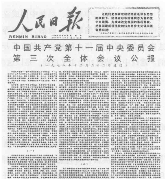
1978年12月23日，《人民日报》刊发的关于十一届三中全会公报的报道

按照原定的安排或设想，中央工作会议和十一届三中全会主要是讨论经济问题。华国锋在中央工作会议开幕式上宣布会议的3项议程：一是讨论如何进一步贯彻执行以农业为基础的方针，尽快把农业生产搞上去的问题，讨论《中共中央关于加快农业发展若干问题的决定