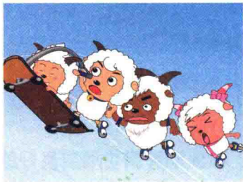
图1-3-1 《喜羊羊与灰太狼》剧照

在不同作品中的角色应该是有所区别的。设计者不能把别人作品中的角色形象略作修改就变为自己剧本中的角色。这样设计出的角色不但有抄袭之嫌，而且也很难得到观众的认可。笔者以为，设计师在进行角色设计之前都要仔细研究剧本的内容，根据剧本对角色的描述，综合故事发生年代、地域、环境等因素，创造、设计出符合剧本内容的角色，使这个角色在外貌特征、习惯动作、表情动作、肢体动作、口型、服装配饰等方面，都具有独特性。国产动画片《喜羊羊与灰太狼》中小羊的造型（图 1-3-1）与比利时动画《蓝精灵》中一群蓝精灵的造型（图 1-3-2），有一定共通性，但小羊造型也具有中国本土文化特色。