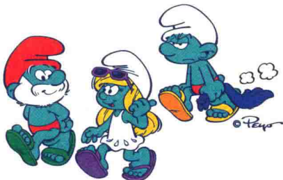
图1-3-2 《蓝精灵》人物形象