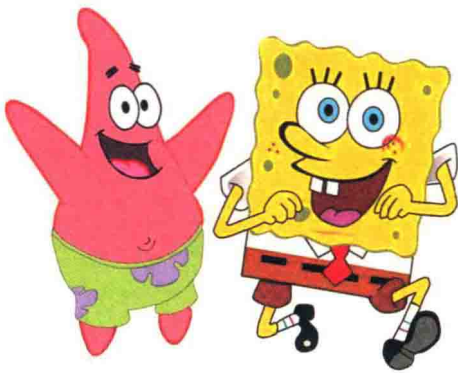
图1-2-2 《海绵宝宝》角色形象

其次，动画角色的风格在一定程度上决定整个动画片的风格，也界定了动画衍生品市场开发的方向。例如，动画片《海绵宝宝》中，海绵宝宝和派大星的设计具有明显的低幼倾向，色彩鲜艳明朗，性格单纯、积极向上又富有冒险精神。这决定了海绵宝宝这部动画片整体属于可爱卡通版动画，受众人群偏向于低幼年龄小朋友（图1-2-2）。又如《小兵张嘎》中嘎子的造型偏写实，角色造型接近生活中真实的人物，决定了这个影片的风格就是写实风格（图1-2-3）。