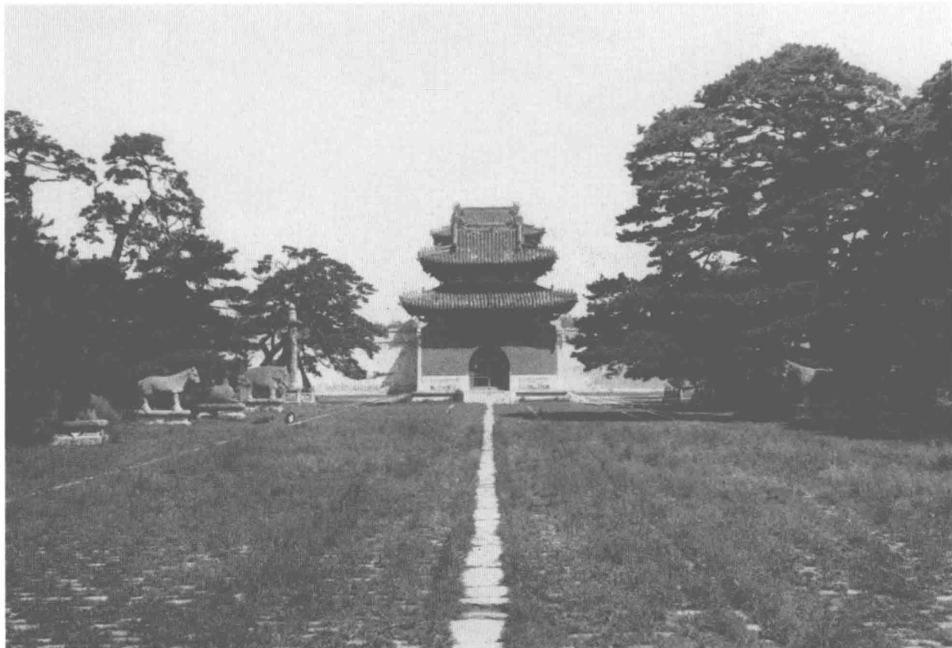
1924—1925年，沈阳，昭陵中庭石兽雕塑。