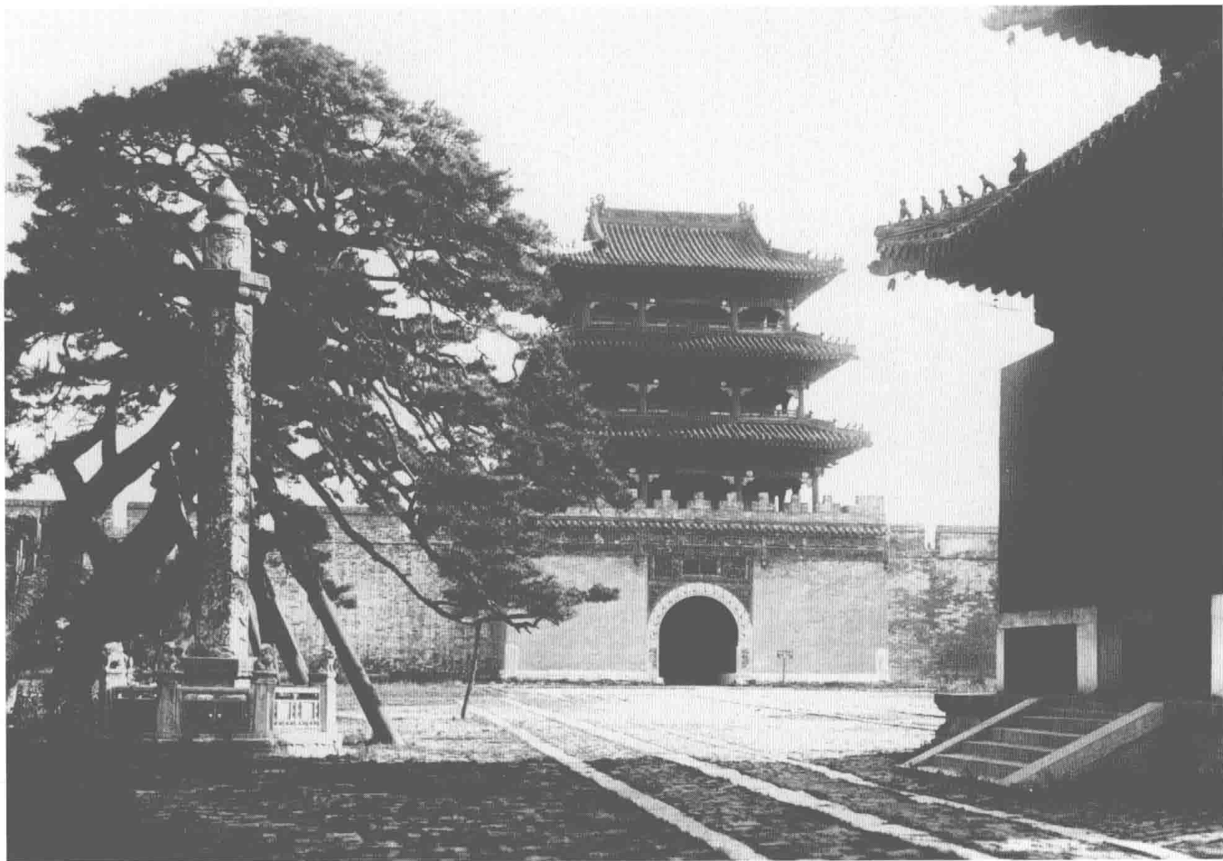
1924—1925年，沈阳，昭陵隆恩门。