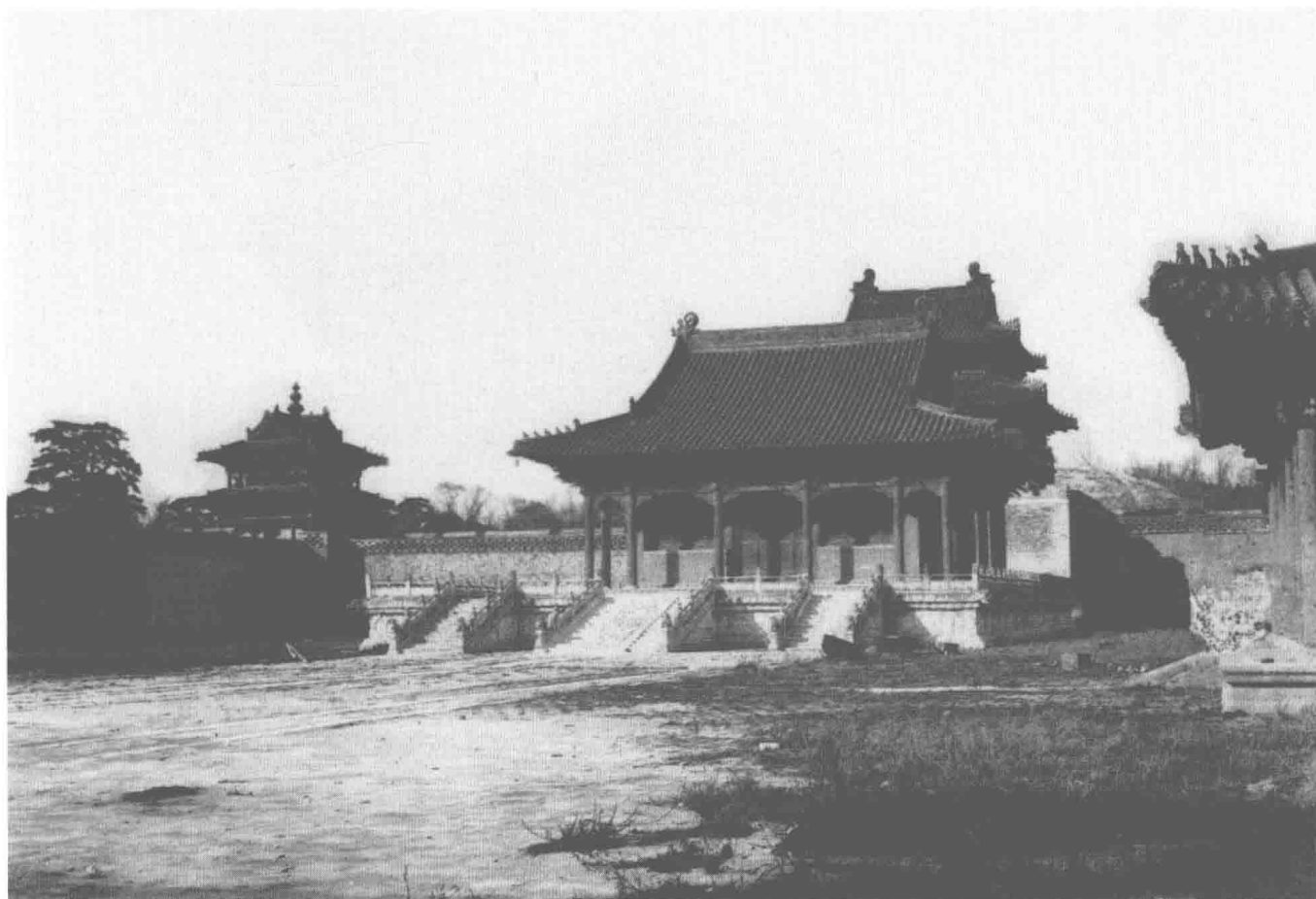
1924—1925年，沈阳，昭陵隆恩殿。