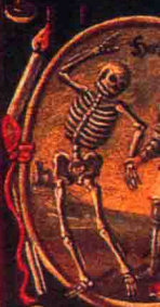
Der Herr ob dem Tod hat.