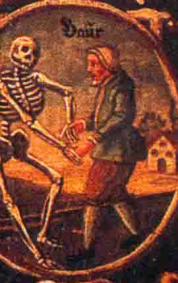
Der Mann auch was unter des Todes fuß.