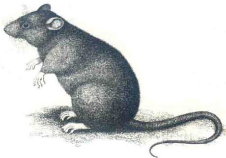
黑鼠原本是一种亚洲热带动物，在古罗马时期，穿过近东地区继续蔓延，在公元6世纪到达欧洲

黑鼠离开家乡的年代就很难考证了，但可以肯定的是，它们是随着丝绸之路来到欧洲的。黑鼠来到西欧很有可能是坐船去的。船上的环境对老鼠来说是天堂。远航的人们把食物和水都堆在船舱里，加上乱堆的衣服，让它们得以温饱。时间一长，船员们也能和老鼠和平共处，一旦船出现异常，老鼠往往最先知道。在航行中一看见老鼠惊慌失措，大家就知道该去抢救生艇了。如果发现船上没有老鼠，哪怕还没有启航，水手们也会拒绝登船，因为肯定有什么