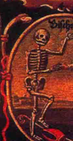
Der Bischoff auf sinen.