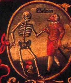
Ein Edel Mann vor dem Todt bleib.