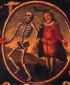
Ein Mensch, wie der ein stündend Bleib.