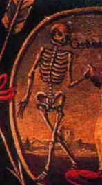
Den Cardinal sin hat.