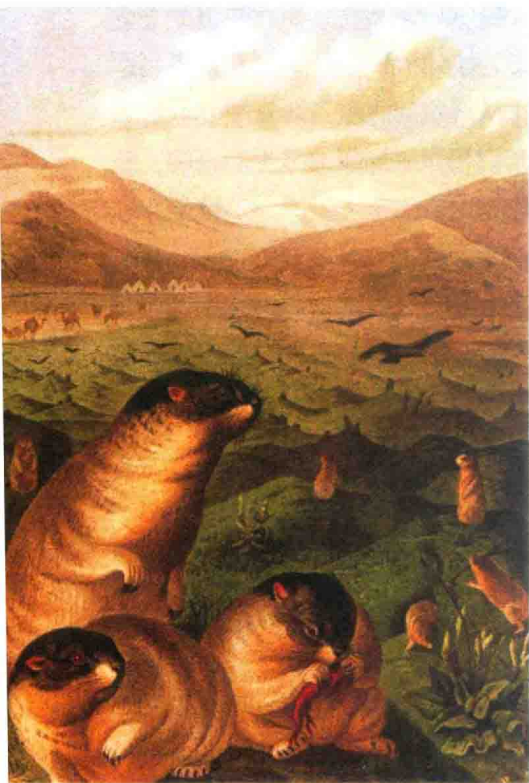
旱獭又名土拨鼠，草地獭，是陆生和穴居的草食性、冬眠性野生动物