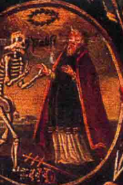
Das Habbes gewalt den Tod überhalt.