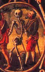
Der Mann, der die Welt hat kalten her.