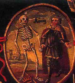
Das Haupt getrouf der Tod nicht schont.