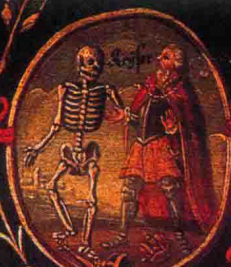
Das Haupt der Welt den Tod heim firt.