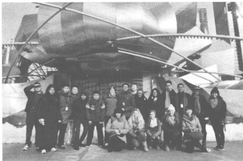
参加“中美青年大使”活动的学生和他们的外国朋友们