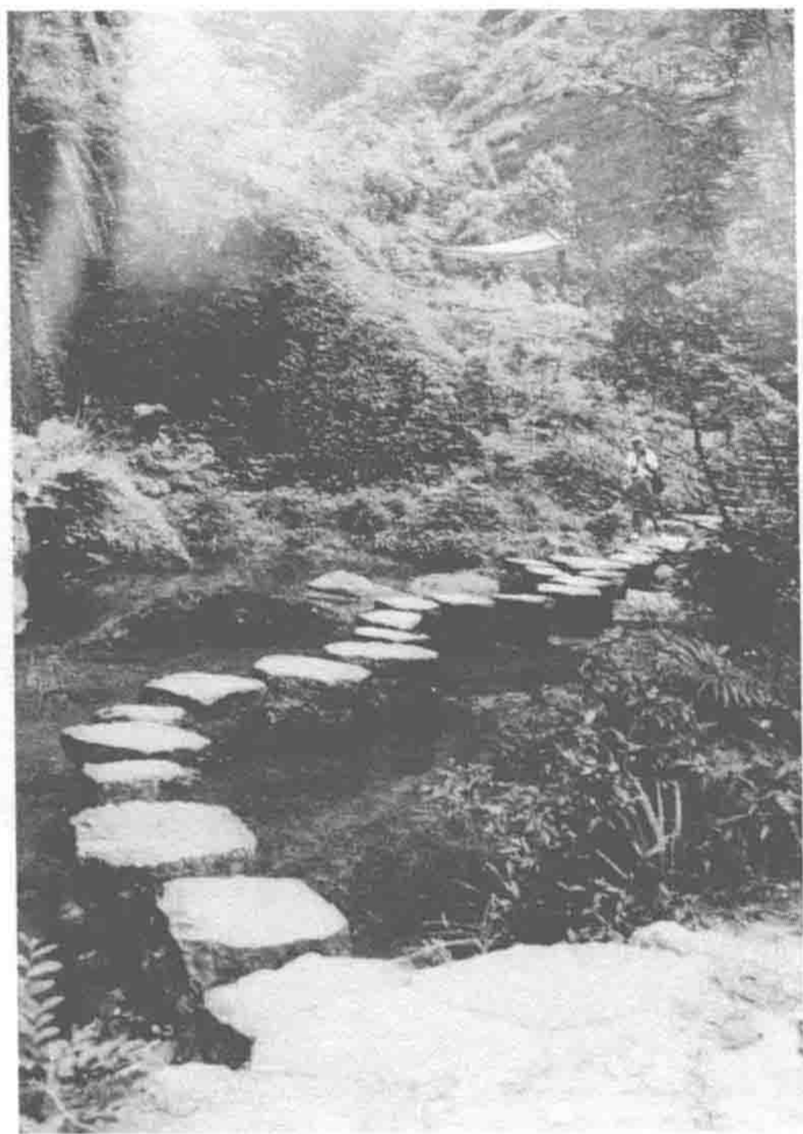
福建武夷山茶林下的踏步桥