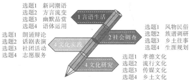
“当代文化参与”课程结构示意图

一年多来我们把任务群四大专题细析成16个选题并进行教学设计和实践。现将成果呈现给读者，希望师生在“当代文化参与”任务群的学习活动中拓展思路，施展身手。