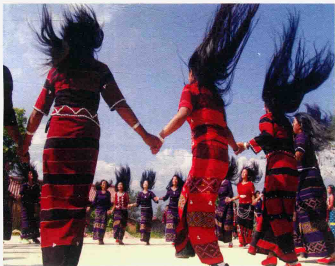
佤族姑娘的“甩发舞”