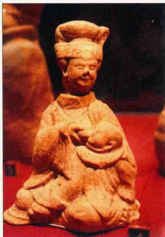
汉代头戴巾帼的 哺乳妇女陶俑

我国很多少数民族都以长发为美。比如能歌善舞的佤（wǎ）族少女就习惯长发披肩，“甩发舞”是她们的传统舞蹈。说到维吾尔族的小姑娘，人们总会想起那一头美丽的小辫子，或几条，或十几条，或几十条，满头的小辫使得维吾尔族小姑娘看上去更加俏皮、可爱。