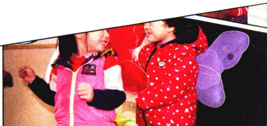
音乐响起来了，孩子们的“森林音乐会”也开始了！

“感悟与反思”不仅针对案例中的教师，更针对正在阅读此案例的教师们，在“写下你的想法”环节，读者既可以设计自己的不同应对方法，也可以对案例中教师的指导行为及其解读提出意见，当然更可以是全新观点的独特表现。如此，读者在这里不仅是案例的读者，更是参与者、同行者，希望教师们能在这里留下即时感慨，亦或深思熟虑，将一本“别人的”案例书变为“自己的”思考宝藏。