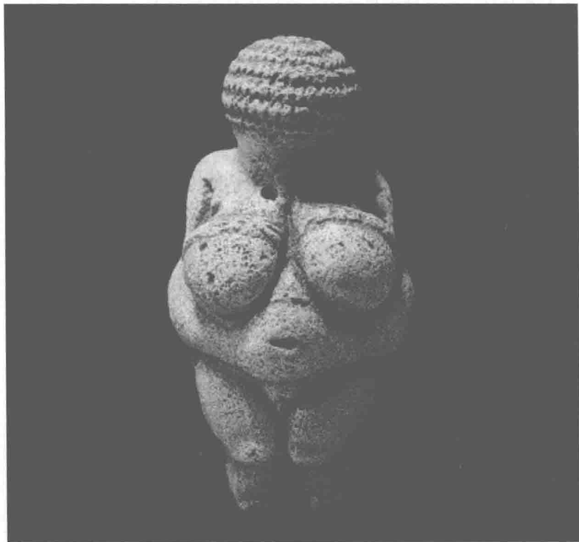
图 1-1 《维伦道夫的维纳斯》

立体物的创造还主要是结合实际使用的需要。随着制陶技术的进步和铁器的运用，雕塑艺术才逐步成熟起来。