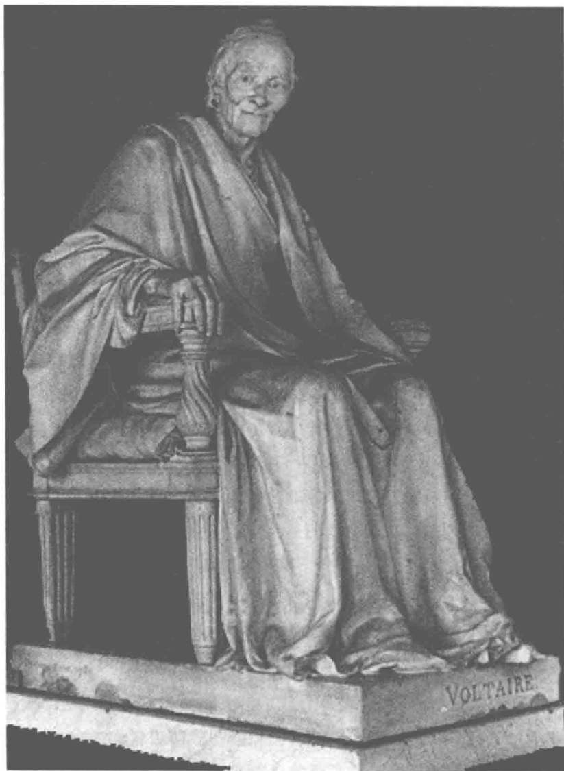
图 1-2 《伏尔泰》