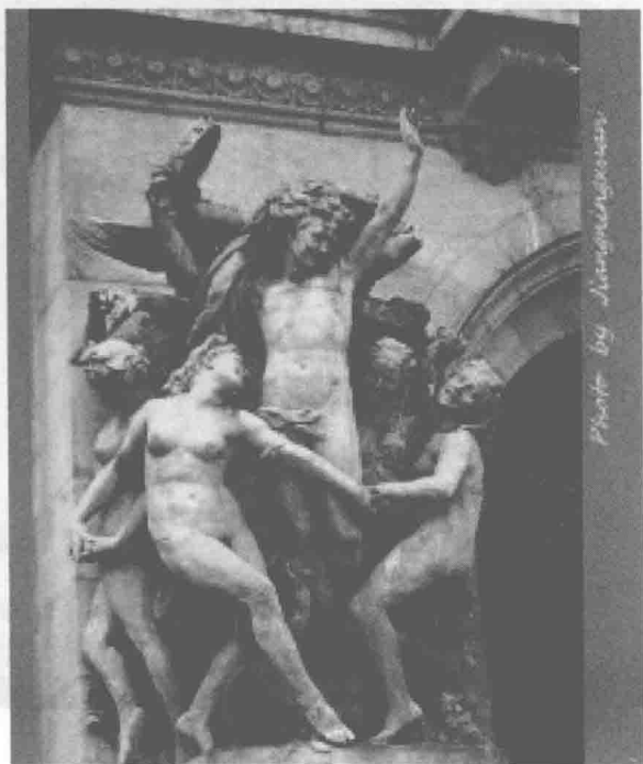
图 1-3 《舞蹈》

19世纪,欧洲的许多城市广场和公共建筑上安置了一大批显示出卓越技艺的纪念碑和纪念性雕塑。法国著名雕塑家让·巴普希斯特·卡尔普以强烈的浪漫主义精神创作了《舞蹈》,整个作品充满了生气,节奏流畅优美。弗朗索瓦·吕德的凯旋门上的《马赛曲》浮雕充满了激情和民族自豪感。浪漫主义作为创作方法和风格,在表现上强调主观与主体性,侧重表现理想世界,把情感和想象提到创作的首位,常用热情奔放的雕塑语言、超越现实的想象和夸张的手法塑造理想中的形象。