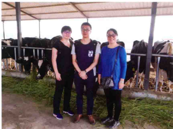
2016年8月11日，食品评估中心专家赴内蒙古伊利集团进行乳头奶采样