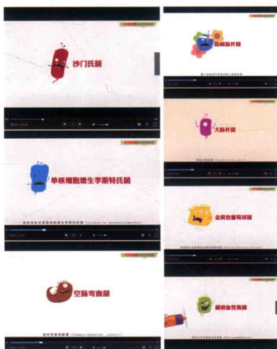
食品评估中心制作食源性致病菌系列动画视频