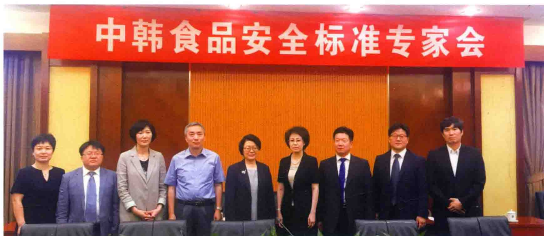
2016年5月25日，第七次中韩食品安全标准专家会在北京召开