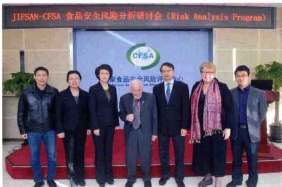
2016年3月14日，JIFSAN-CFSA食品安全风险分析研讨会在北京召开