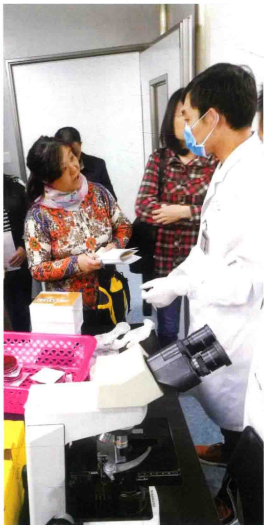
2016年食品评估中心专家在广西贵港市人民医院调研特定病原体检验情况