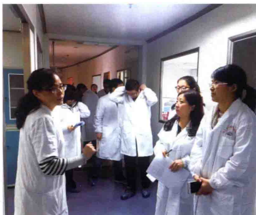
2016年食品评估中心专家在南昌市疾病预防控制中心督导检查