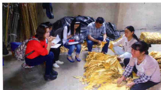
食品评估中心专家走进居民家中开展食物消费量调查