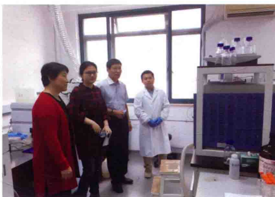
2016年食品评估中心专家赴上海生科院进行检测工作督导