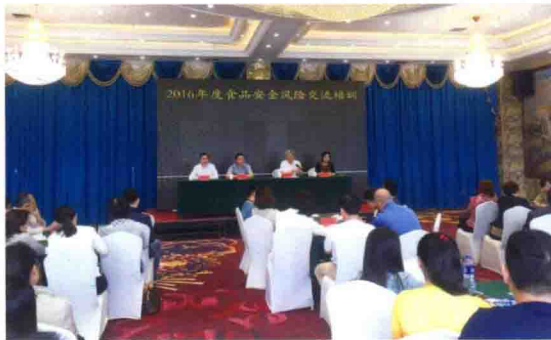
2016年5月23日，2016年度第一期食品安全风险交流培训班在长春举办