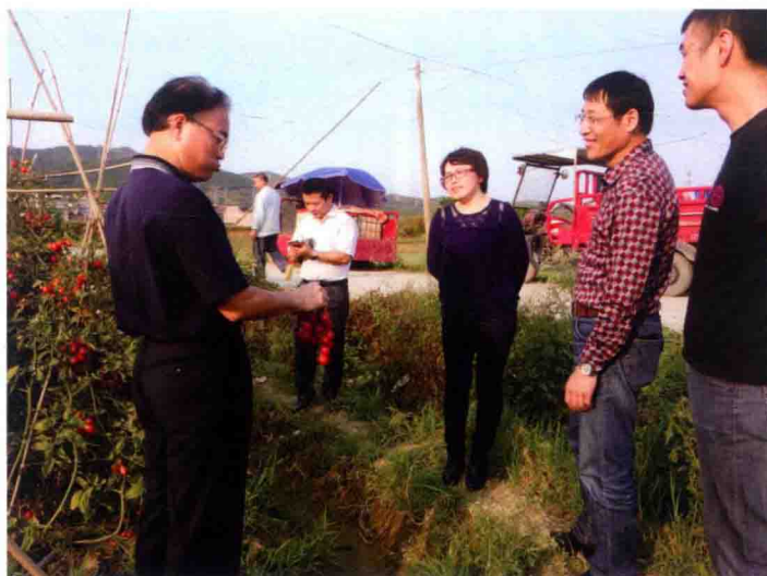
2016年食品评估中心专家赴广西进行矿区主要植物性食品铝本底项目现场督导