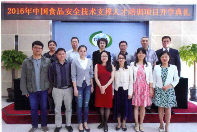
2016年5月10日，食品评估中心召开2016年中国食品安全技术支撑人才培养项目开学典礼。