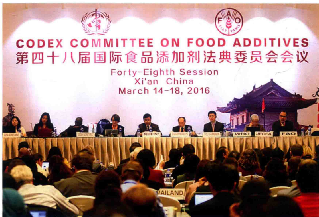
2016年3月14 - 18日，第48届国际食品添加剂法典委员会会议在西安举行