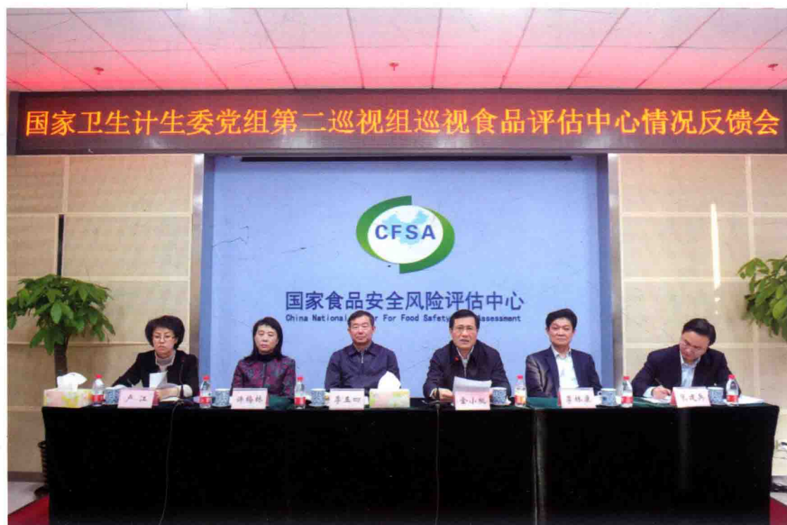
2016年1月28日，国家卫生计生委党组第二巡视组巡视食品评估中心情况反馈会