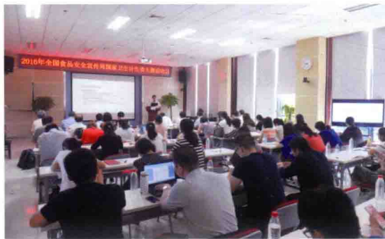
2016年6月21日，2016年全国食品安全宣传周暨国家卫生计生委主题活动日在北京举办