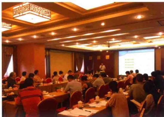
2016年7月11日，食品评估中心在北京召开分中心（技术合作中心）食品安全技术交流会。来自食品评估中心、军事医学科学院分中心、中科院上海生科院分中心、海洋食品技术合作中心、应用技术合作中心等所属12家单位的50多位专家和研究人员参加会议