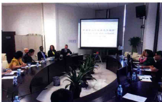
2016年9月27 ~ 28日，食品评估中心召开中美食品安全技术交流会