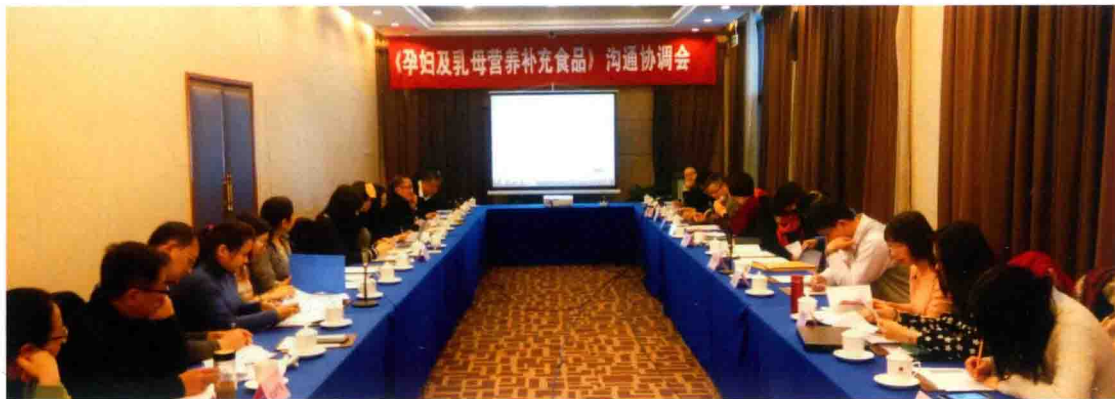
2016年1月27日,《孕妇及乳母营养补充食品》标准沟通协调会在北京召开