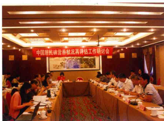
2016年5月24日，中国居民碘营养状况再评估工作研讨会在北京召开