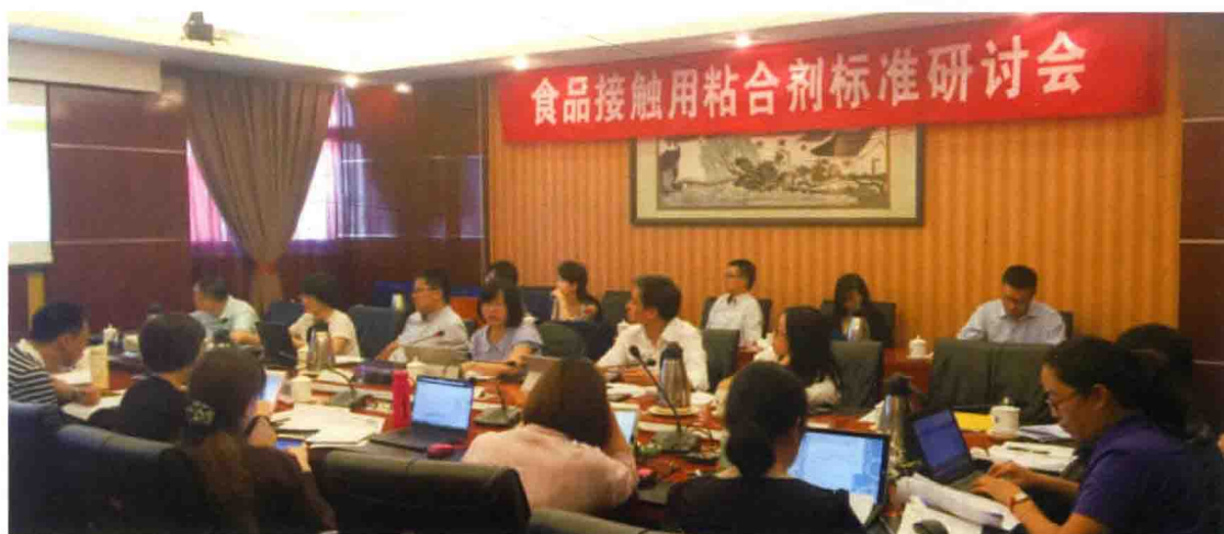
2016年6月15日，食品接触用粘合剂标准研讨会在北京召开