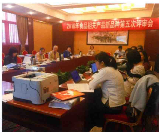
2016年10月11日，2016年食品相关产品新品种第五次评审会在北京召开