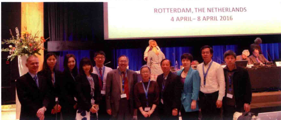
2016年4月4日，食品评估中心参加第10届国际食品法典污染物委员会会议