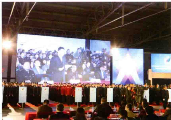
2016年11月14日，2016年国家食品安全风险评估中心大型应急演练暨卫生应急现场处置专家组成立大会在北京召开