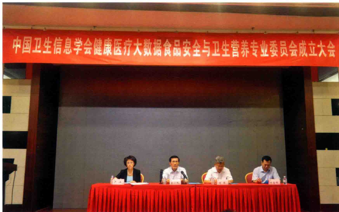
2016年7月29日，中国卫生信息学会健康医疗大数据食品安全与卫生营养专业委员会成立大会暨第一次专委会会议在北京召开。国家卫生计生委副主任、中国卫生信息学会会长金小桃出席会议并致辞