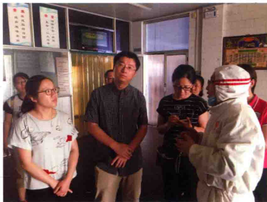
2016年食品评估中心专家赴河南安阳开展肉鸡屠宰厂现场调研