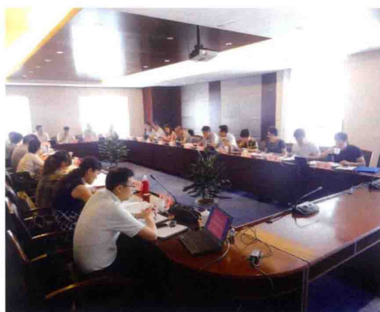
2016年9月9日，食品安全地方标准专题研讨会在南京召开