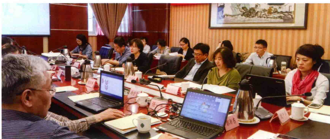
2016年5月5日，婴幼儿食品和乳品中乳清蛋白检验方法研讨会在北京举办