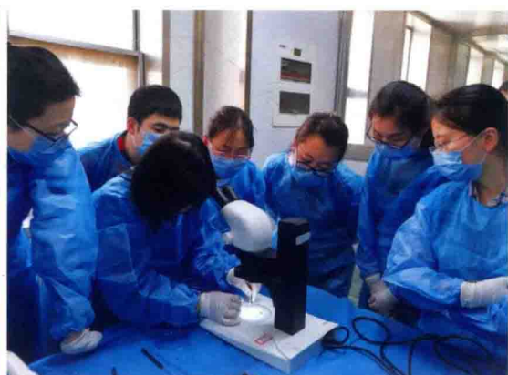
2016年国家食品安全风险监测真菌毒素检测技术培训现场