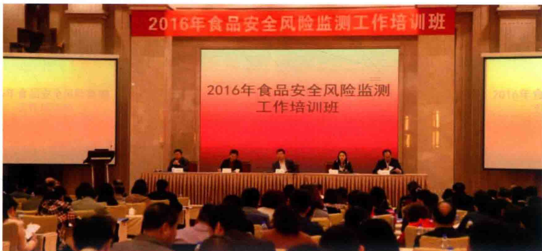
2016年3月2日，2016年国家食品安全风险监测工作培训班在武汉召开