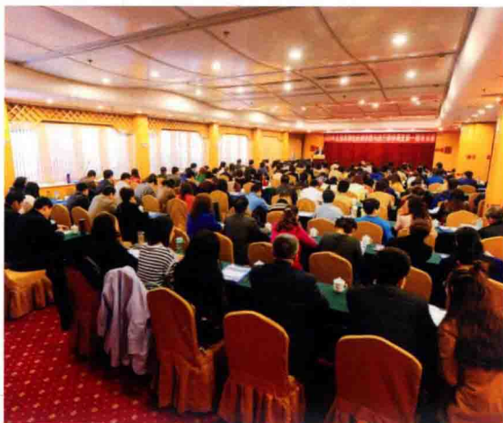
2016年3月31日、4月6日，全国食源性疾病诊断与流行病学调查培训班在福州和西安举办