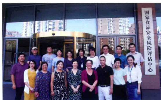
2016年9月5 ~ 13日，第二届中美食源性疾病监测技术交流活动在京举办