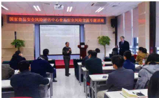
2016年1月15日，中国食品安全技术支撑人才培训项目风险交流团队外籍专家对食品评估中心职工进行风险交流专题培训