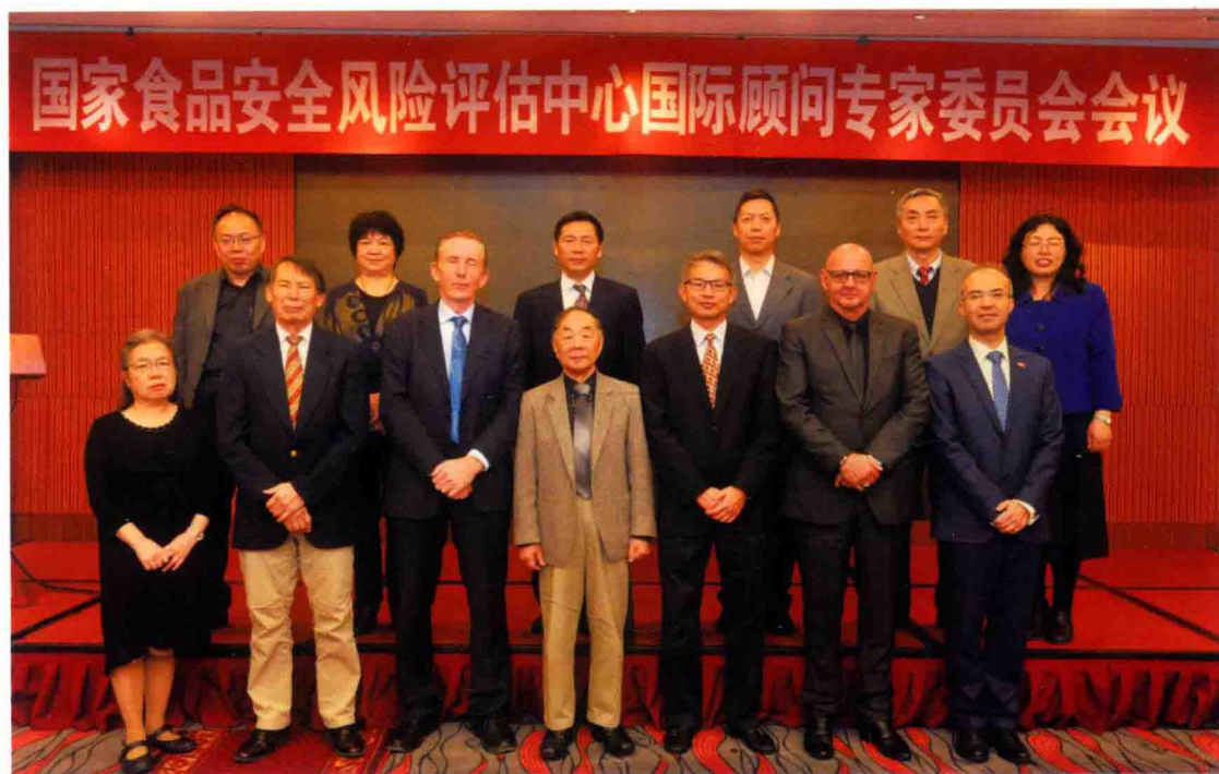
2016年10月24 ~ 25日，食品评估中心在北京召开国际顾问专家委员会2016年全体会议