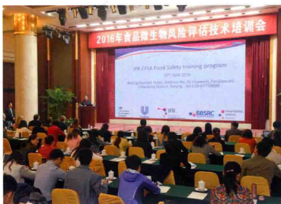
2016年4月20日，全国食品微生物风险评估技术培训会在北京召开