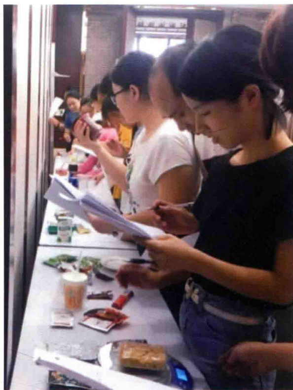
食品评估中心开展食物消费量调查工作