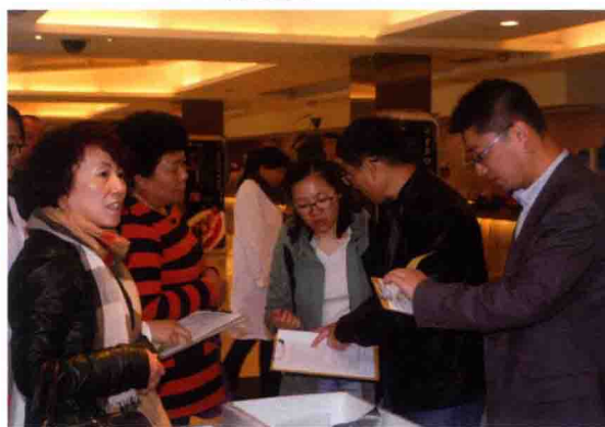
2016年食品评估中心专家赴佳木斯进行餐饮环节单增李斯特菌环境监测项目现场督导