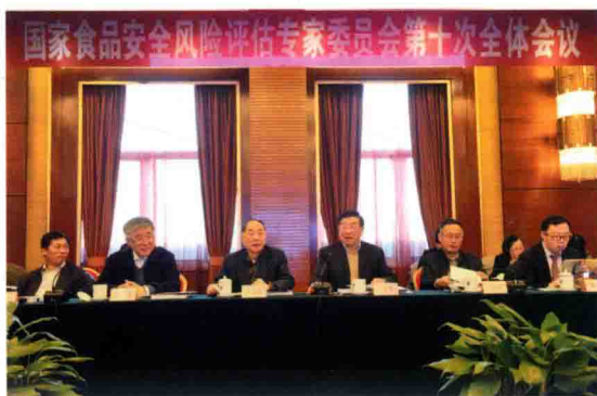
2016年2月24日，国家食品安全风险评估专家委员会第十次全体会议在北京召开