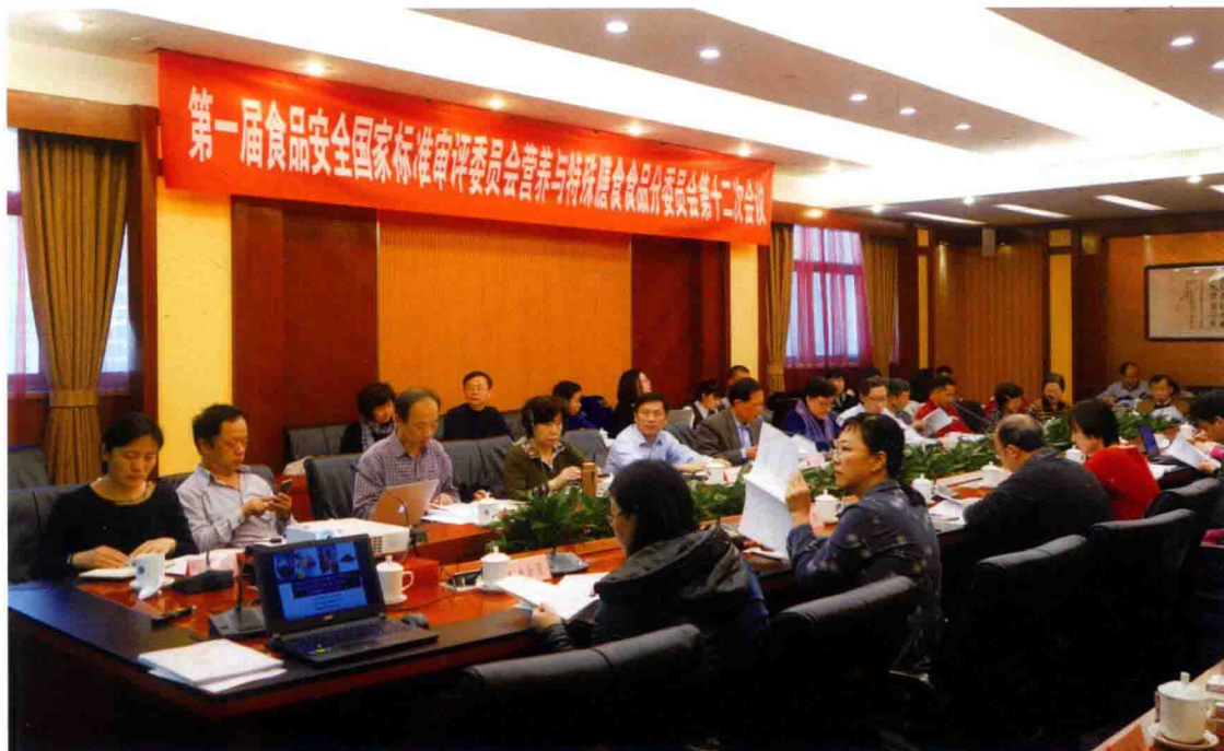
第一届食品安全国家标准审评委员会营养与特殊膳食食品分委员会第十二次会议在北京召开