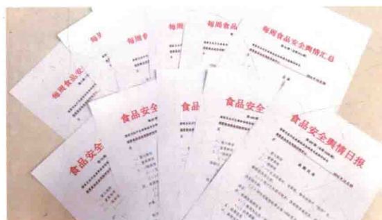
食品评估中心撰写舆情日报250期，周报50期