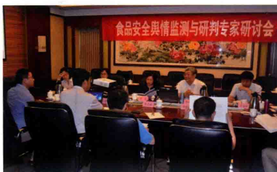
2016年5月26日，食品安全舆情监测与研判专家研讨会在北京召开