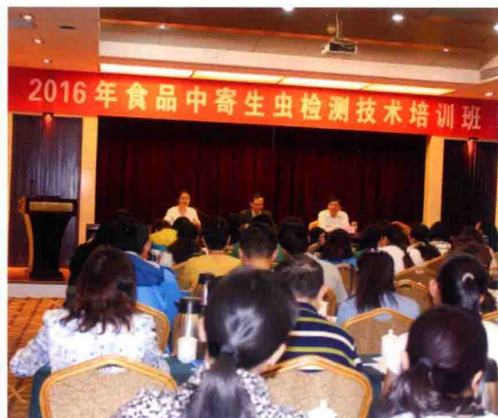
2016年5月17日，全国食品中寄生虫检测技术培训班在郑州举办