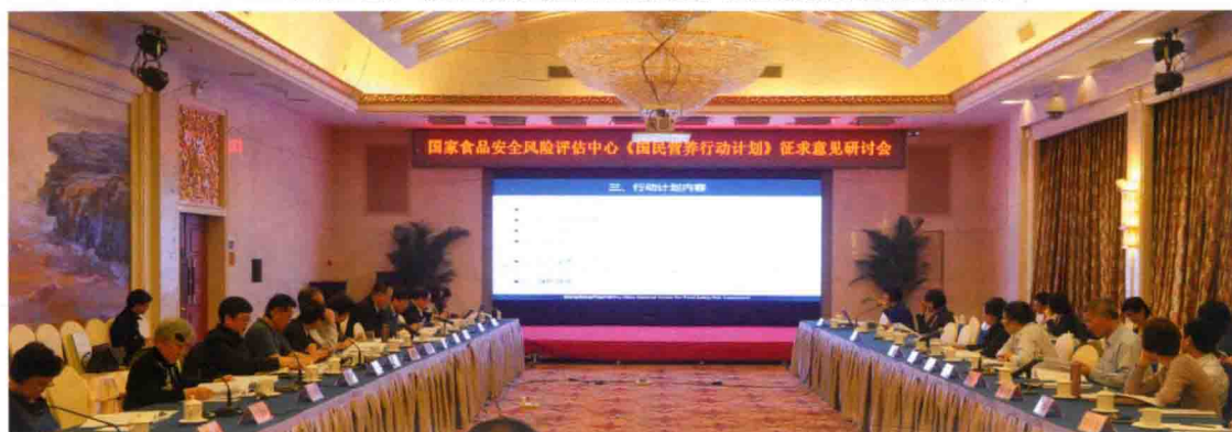
2016年4月21日,国民营养计划征求意见研讨会在北京召开