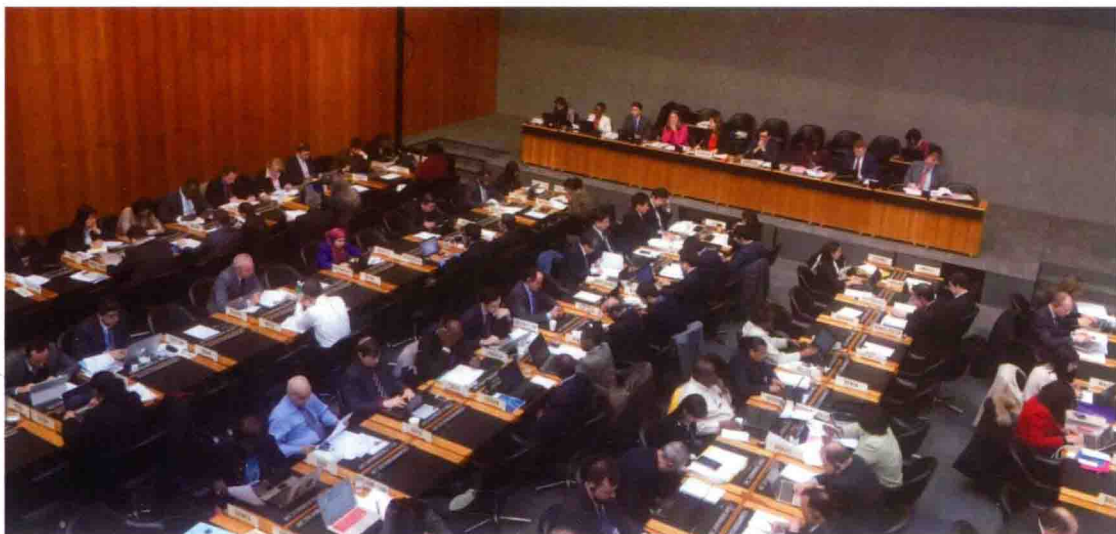
2016年3月14日，食品评估中心派员参加WTO/SPS委员会第65次例会