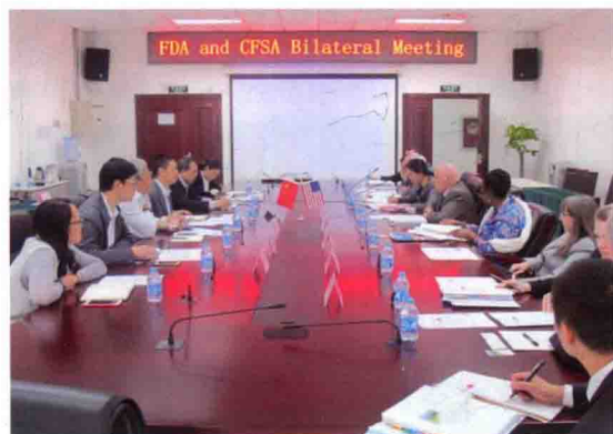
2016年4月21日，美国食品药品监督管理局副局长史蒂芬·奥斯特洛夫博士一行访问食品评估中心