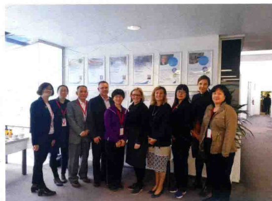
2016年5月31日，食品评估中心与新西兰初级产业部开展学术交流