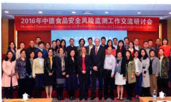
2016年10月27 ~ 28日，食品评估中心在北京召开中德食品安全风险监测工作交流研讨会