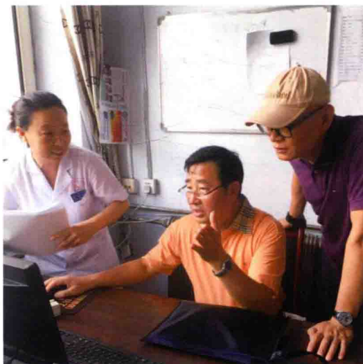
2016年食品评估中心专家在黑龙江哨点医院调研食源性疾病病例监测报告情况