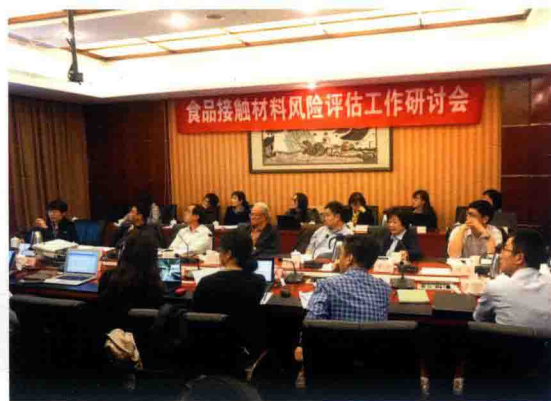
2016年5月14日，食品接触材料风险评估工作研讨会在北京召开