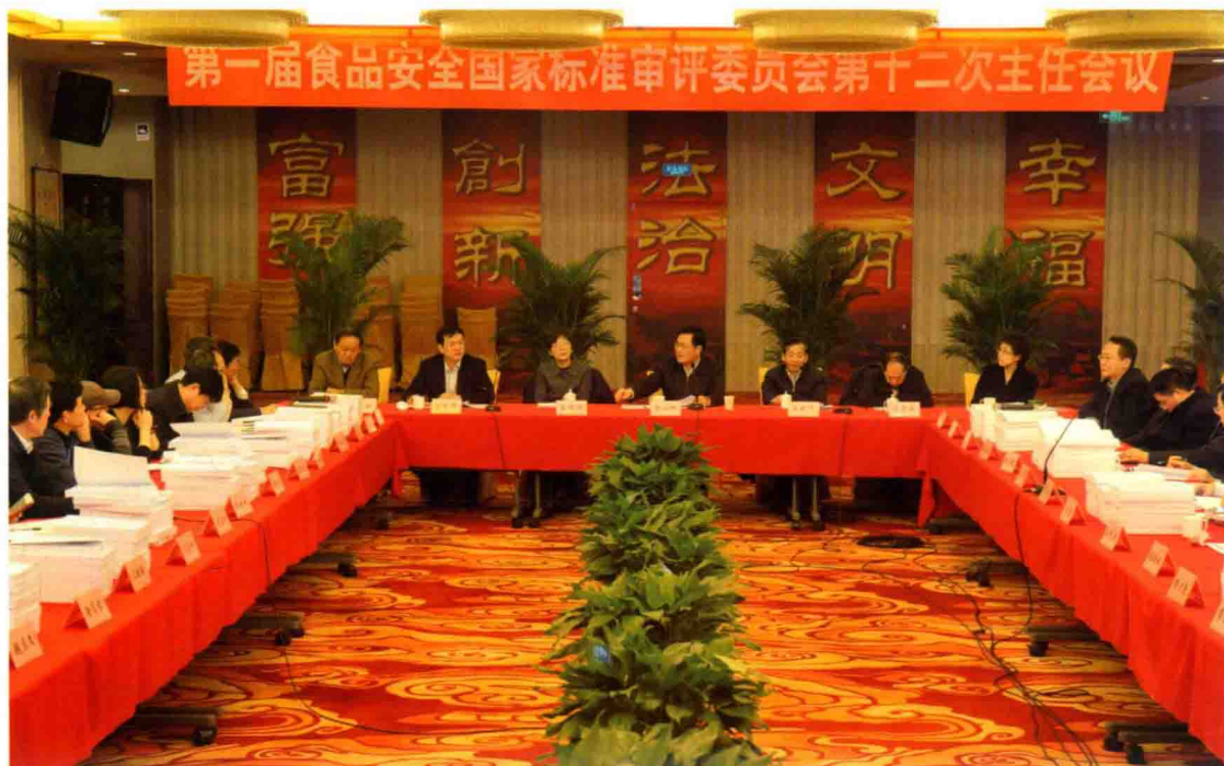
2016年1月18日，第一届食品安全国家标准审评委员会第十二次主任会议在北京召开。国家卫生计生委副主任、审评委员会常务副主任委员金小桃，农业部副部长、审评委员会副主任委员陈晓华，国务院食品安全办副主任、国家食品药品监督管理总局副局长王明珠出席会议并作重要讲话