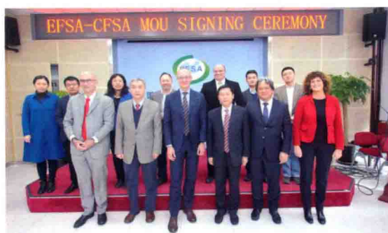
2016年11月1日，欧盟食品安全局局长尤尔博士率一行访问食品评估中心