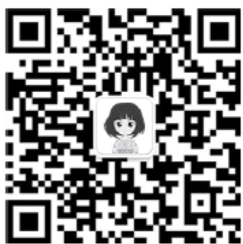
“播妞学姐”微信公众号

2. 针对高校学生在学习过程中存在的压力等问题, 我们还面向大学生量身打造了“IT 技术女神”——“播妞学姐”, 可提供教材配套源码和习题答案, 以及更多 IT 学习资源, 同学们快来关注“播妞学姐”的微信公众号: boniu1024。