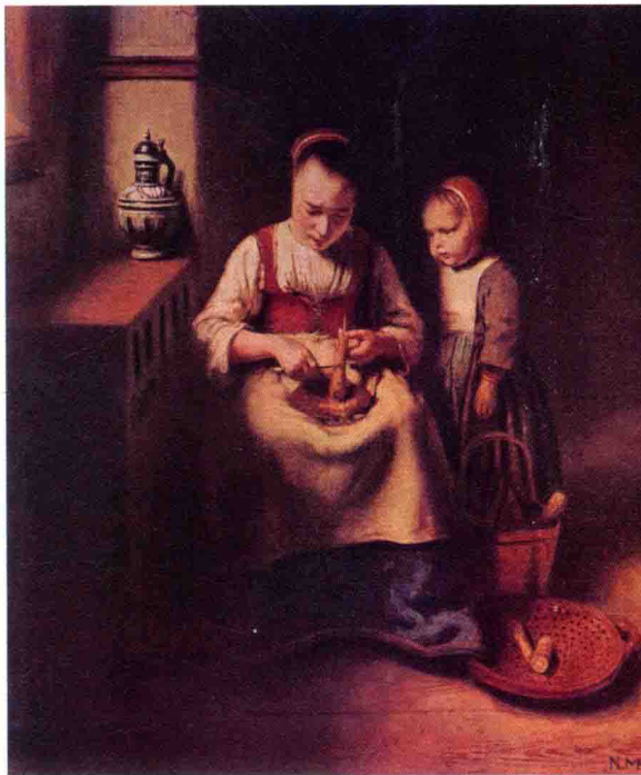
尼古拉斯·梅斯 站在削胡萝卜皮的女人身旁的孩子 1655年 木板油画 35.6cm × 29.8cm 伦敦英国国家美术馆

右图是一幅十分朴素的美术作品，它是不太知名的荷兰风俗画家尼古拉斯·梅斯的作品。这幅作品名为《站在削胡萝卜皮的女人身旁的孩子》，长长的题目让我们对作品的内容一目了然。这幅作品中没有什么大人物，也没有什么知名的事件。除了能够显示当时流行风尚的陶器，似乎也没有值得一提的物件，画面描画的只是一个小女孩望着正在做家务的妇女的场景。在绘画技巧方面，只是中规中矩地使用了卡拉瓦乔的明暗对比法。那么，问题就在于，这再平凡不过的