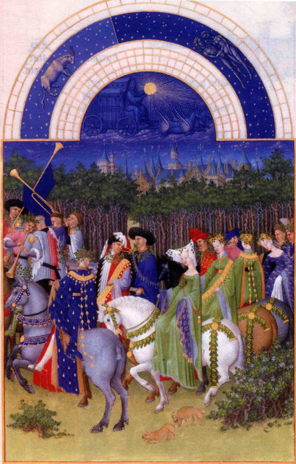
林堡兄弟 贝里公爵的豪华时祷书