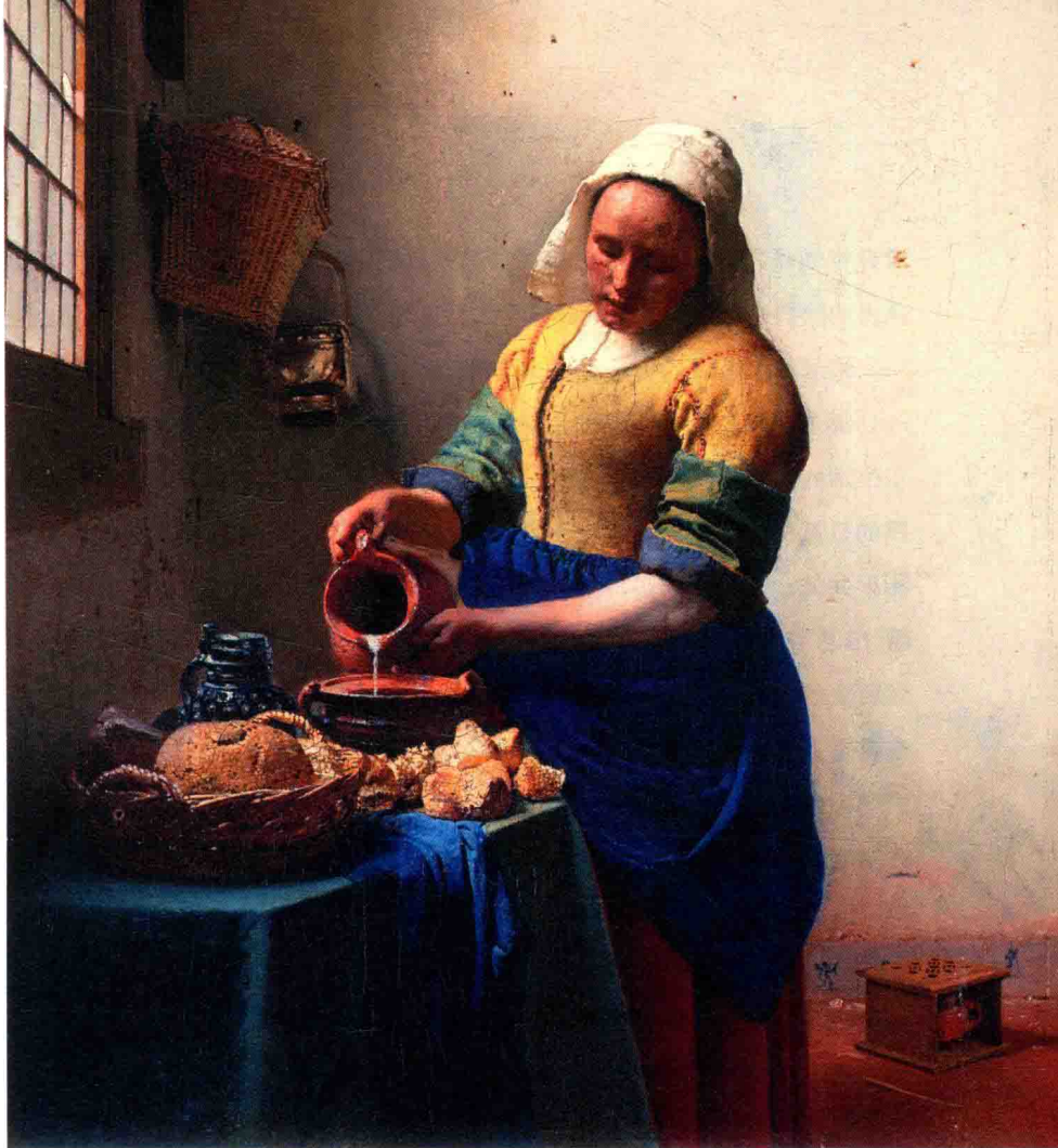
约翰内斯·维米尔 倒牛奶的侍女