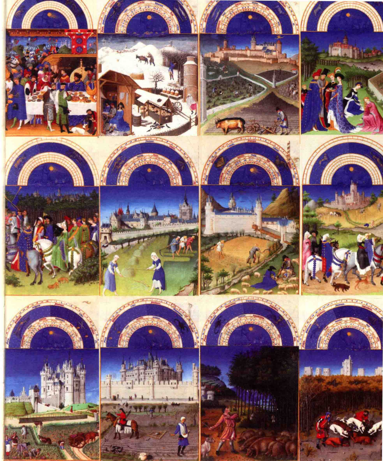
林堡兄弟 贝里公爵的豪华时祷书(5月)