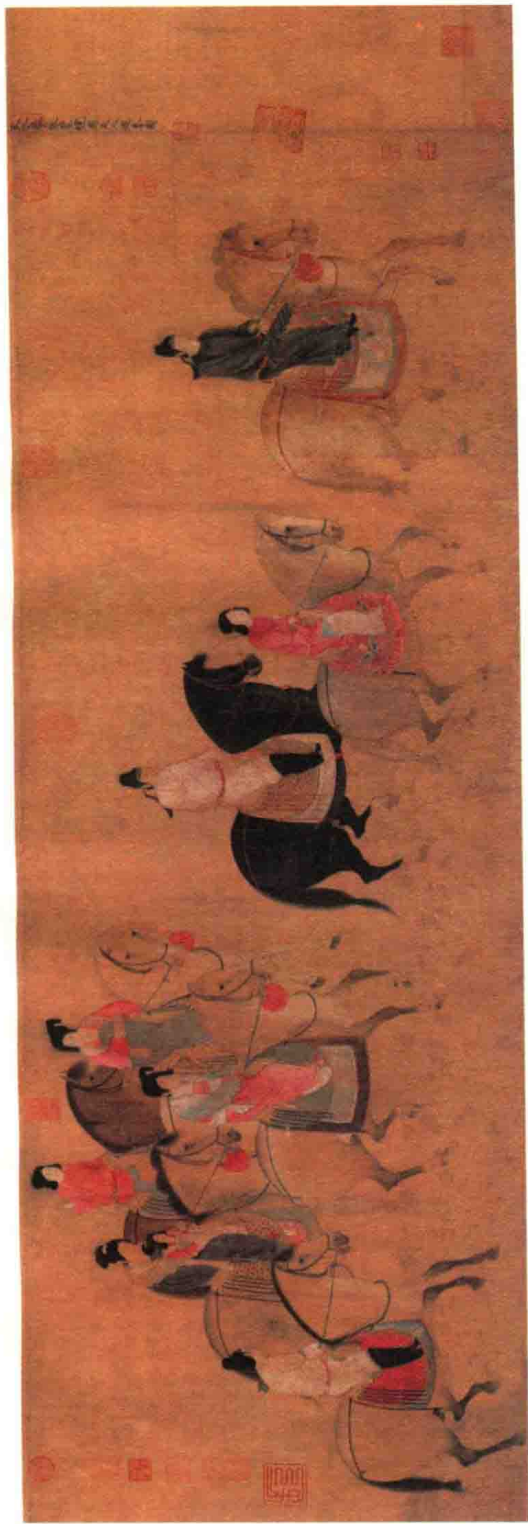
〔唐〕张萱《虢国夫人游春图》（宋摹本）