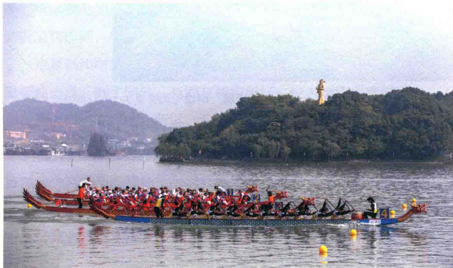
钱湖龙舟

宁波是海上丝绸之路的始发港之一，伴随着航运业的发展，很早开始人们便频繁闯荡海外，从事海上贸易。近代以来，大批宁波人以上海为舞台，艰苦创业，打下宏大基业，并以此为跳板，走向全国，移