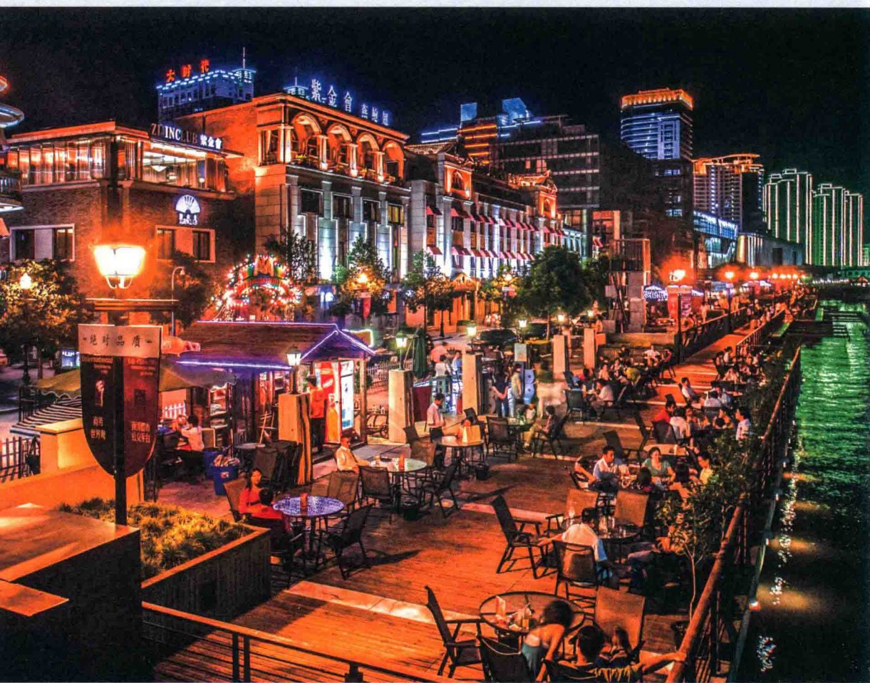
热闹的老外滩