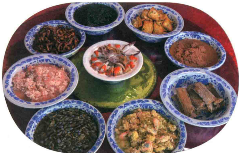
宁波人的“咸下饭”

宁波是沿海城市，海产品丰富，人们对海鲜有很深的依赖。过去没有冷藏保鲜设备，捕捞上来的海产品除了部分鲜食以外，多数用腌、晒、晾等办法保存，作为日常的下饭菜。我印象中，几乎所有的海产品都可以腌制，咸带鱼、咸黄鱼、咸鲳鱼、咸鳓鱼，像海蜇头、海