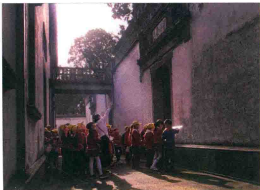
虞洽卿故居

打疼了孩子，于是便高高举起，轻轻拍打，搞得孩子虚惊一场。夫妻吵架也是如此，为了鸡毛蒜皮的事争个面红耳赤，甚至气势汹汹威胁使用武力，可毕竟心疼对方，一方沉默，一方检讨，夫妻便和好如初。