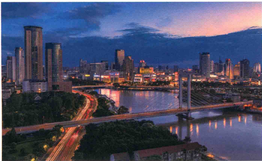
绚丽宁波夜

曾经有一个广为流传的说法，说的是一位中央领导考察宁波，用过晚餐后返回驻地，路过宁波主要商业街，当时不过晚上九点左右，但街上已是门庭冷落车马稀。首长不禁问道，宁波人都去哪儿了，是不