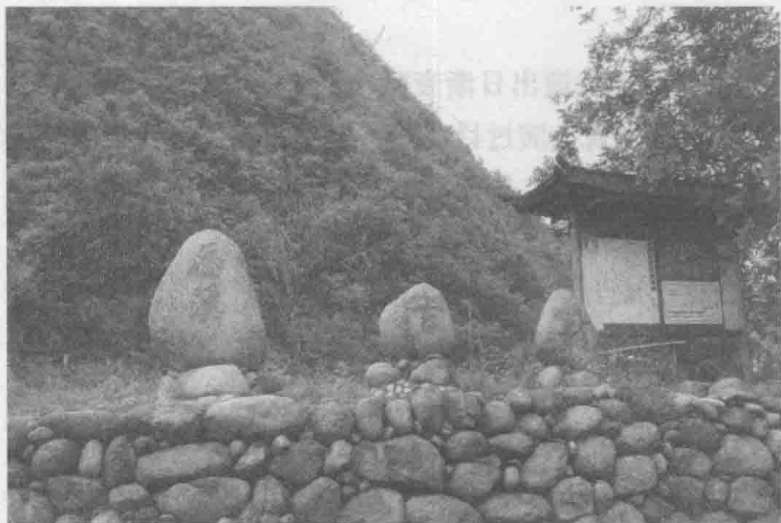
图1 目连戏考察地历溪村——村头一景

重要的研究价值。于是，2008年7月6日到12日，我深入历溪村对那里目连戏的生存现状进行实地调查。其间走访了演员、负责目连戏演出的村干部、当地群众以及祁门县文化部门的相关领导，拍摄录像资料、照片，搜集了第一手资料，了解目连戏的过去现在，尤其是目连戏的生存现状；同时也到附