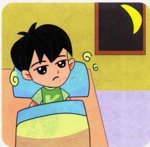
快快晚上一个人在家。