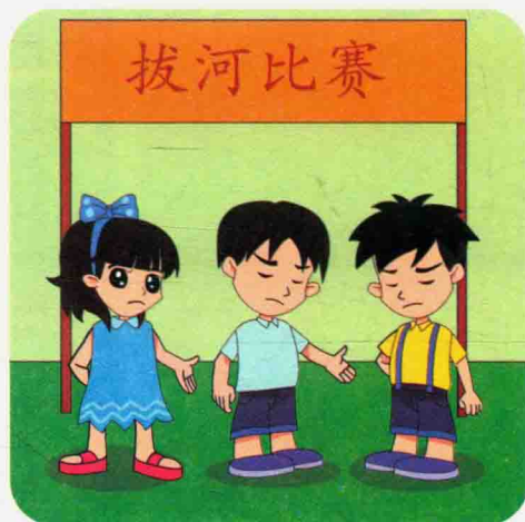
拔河比赛，我们班输了！