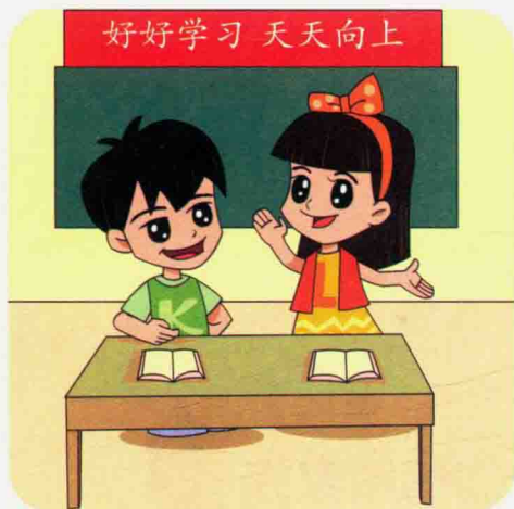
课堂上，乐乐被老师表扬。